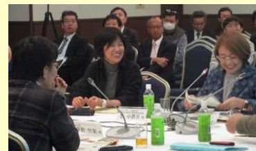
意見交換会の様子 (食)