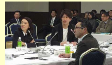
意見交換会の様子 (観光)