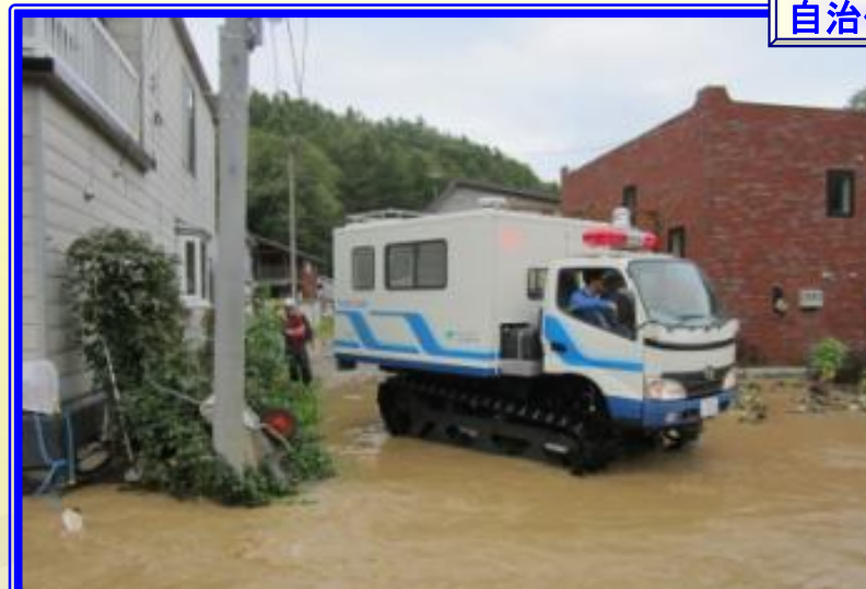
H26.9 大雨による出動（札幌市）