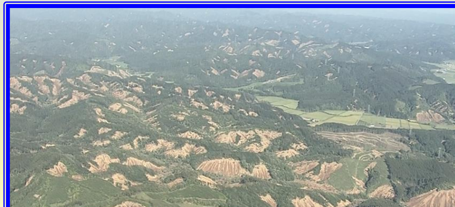
H30.9 胆振東部地震 被災状況調査(厚真町)