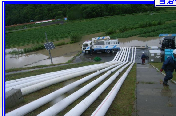
H26.8 大雨による出動(音威子府村)