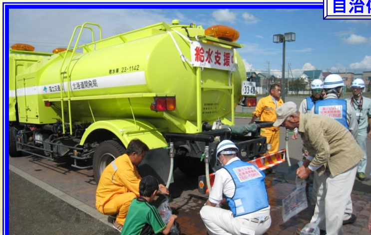
H26.9 江別市 市民への飲料水の給水（上江別小学校）