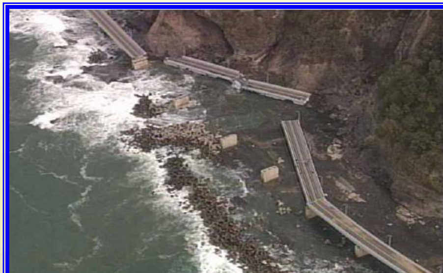
H16.9 一般国道229号大森大橋落橋の様子(神恵内村)