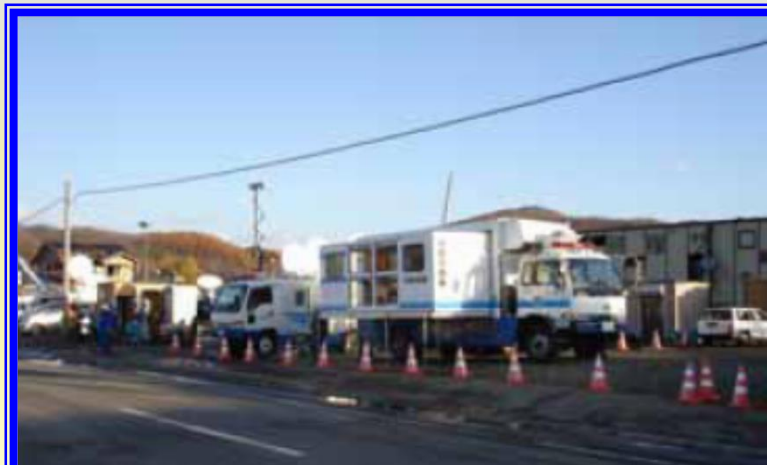
H18.11 突風災害による出動(佐呂間町)