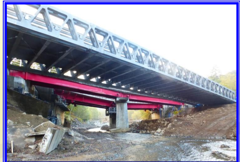
H26 一般国道453号恵庭市奥漁川橋架設状況