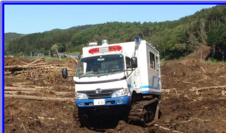
H30.9 胆振東部地震による出動（厚真町）