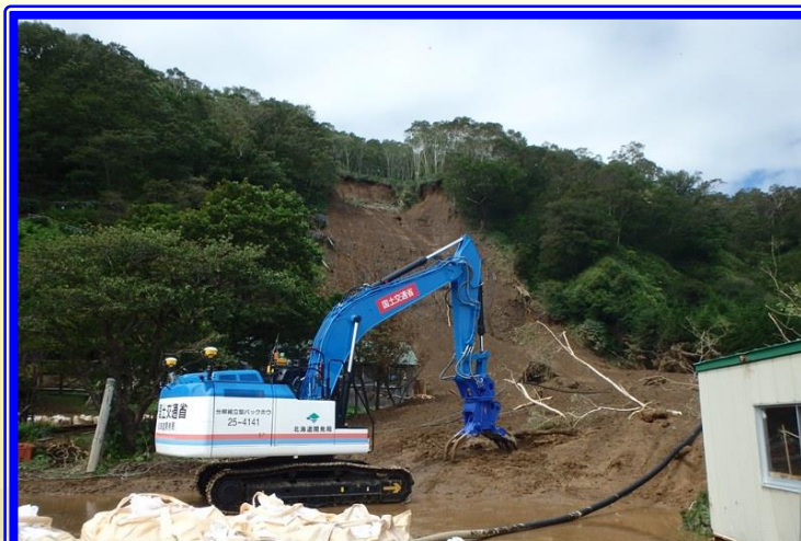
H28.8 遠隔操作による流木除去状況(羅臼町)