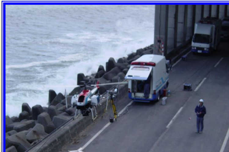
H16.1 一般国道336号 斜面崩壊による出動(えりも町)