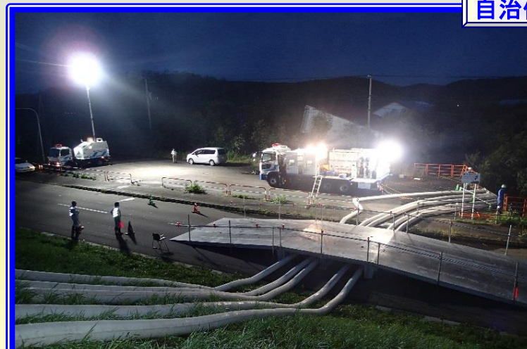
H28.8 大雨による出動(豊頃町)