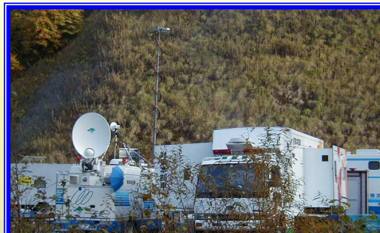
H13.10 一般国道333号 北見市北陽土砂崩落による出動(北見市)