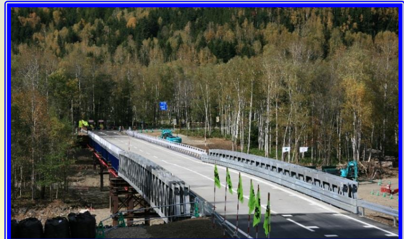
H28.8 一般国道273号上川町高原大橋架設状況