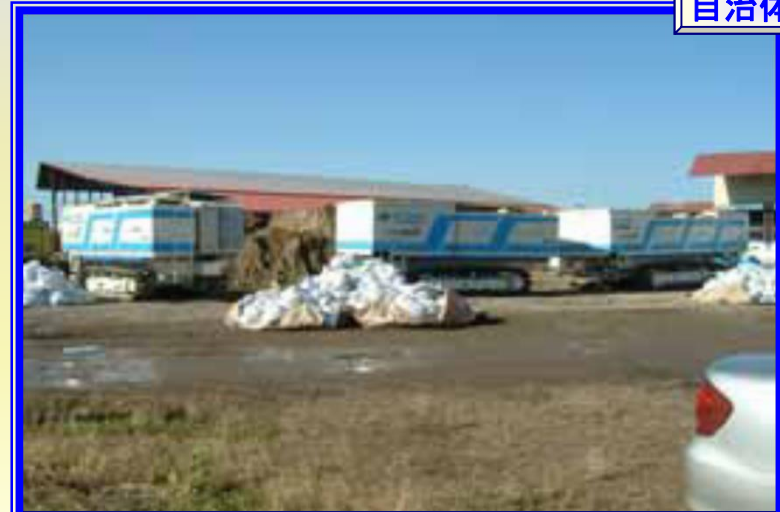
H18.10 低気圧による大雨による出動(美幌町)