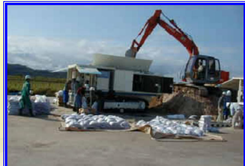
H13.9 台風15号による出動(女満別町)