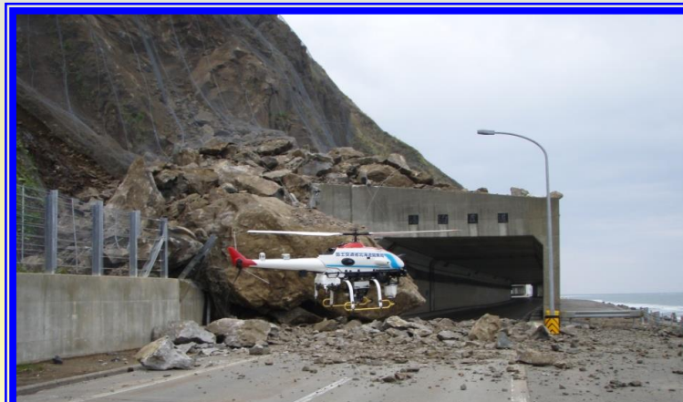
H20.5 一般国道231号 における落石による出動(増毛町)