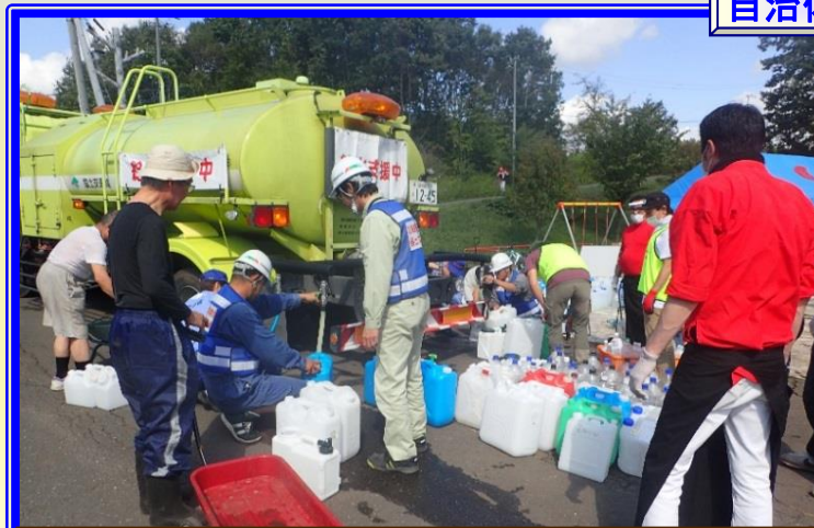
H30.9 胆振東部地震 安平町 市民への飲料水の給水