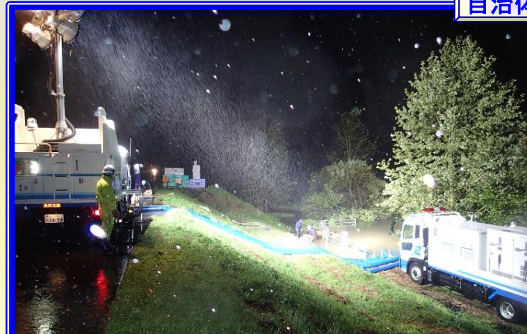
H28.8 十勝川水系途別川 大雨に伴う緊急排水作業による出動(幕別町)