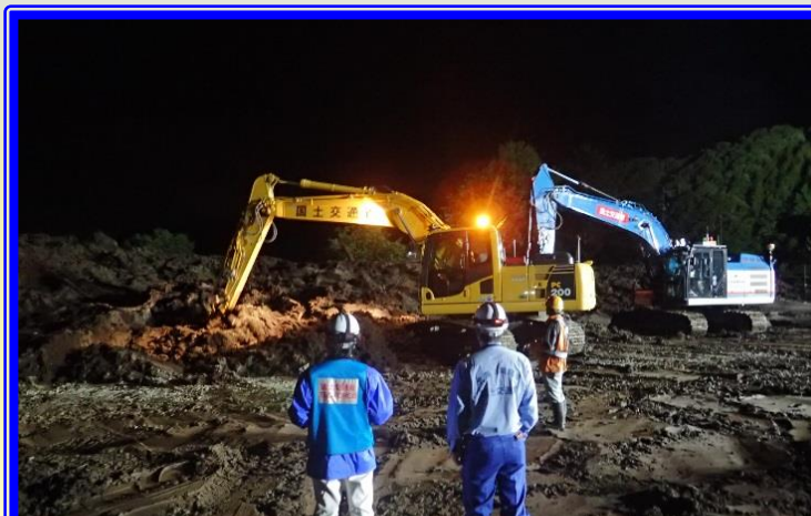
H30.9 胆振東部地震による 河道閉塞土砂撤去状況(厚真町)