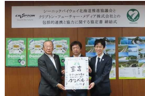
クリプトン・フューチャー・メディア (株)