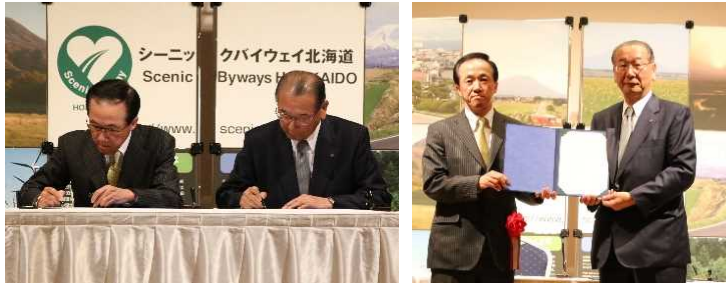
(一社) 北海道信用金庫協会