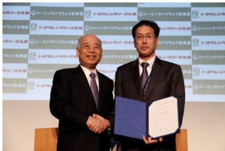
トヨタレンタリース札幌