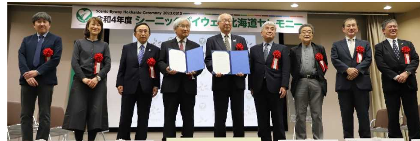
NPO法人北海道遺産協議会