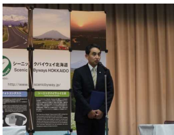
デンソーセールス 北海道支社