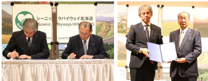
北海道地区「道の駅」連絡会