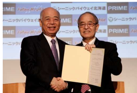
Follow Me Japan. Pte. Ltd. 北海道コカ・コーラボトリング