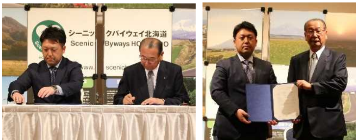
(株)知床グランドホテル