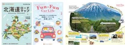
・ドライブMAP/ドライバーサポートコンテンツ