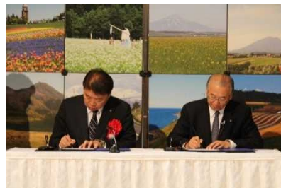
北海道日本ハムファイターズ