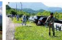
多様な主体の連携による取組