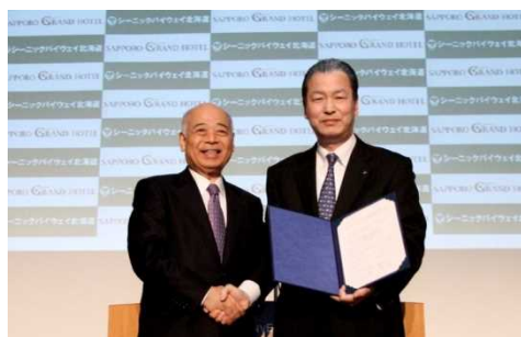
札幌グランドホテル