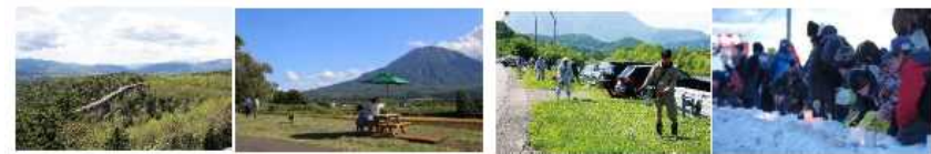
地域資源を活かした取組