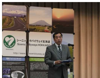
鶴雅グループ 阿寒グランドホテル