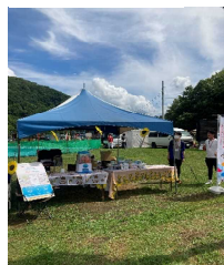
イベントでのブース出展