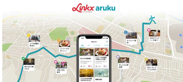
ウォーキングアプリ「Linkx aruku（リンクロス アルク）」