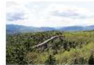
地域資源を活かした取組