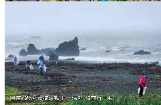
国道228号清掃活動 月一活動(松前折戸浜)