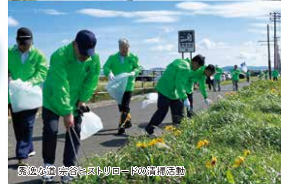
秀逸な道 宗谷ヒストリックロードの清掃活動