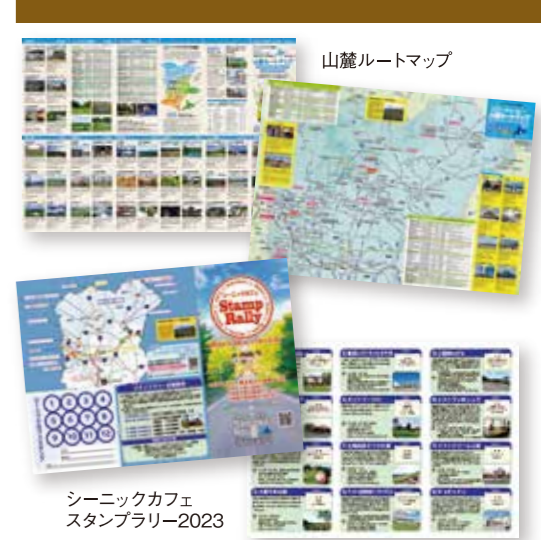
山麓ルートマップ