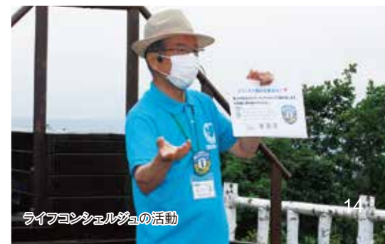
ライブコンシェルジュの活動