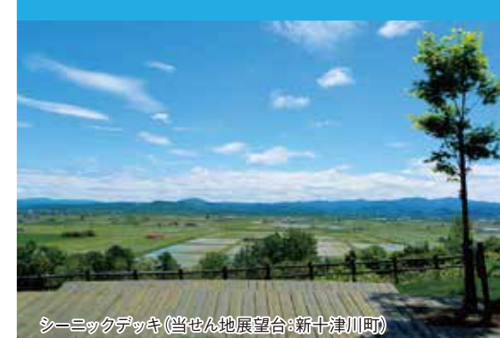
シーニックデッキ(当せん地展望台:新十津川町)