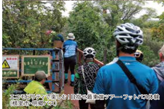
エコモビリティで楽しむ! 目指せ最東端ツアー・フットバス体験(根室市・明郷バス)