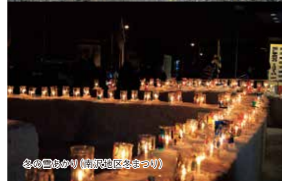
冬の雪あかり(南沢地区冬まつり)