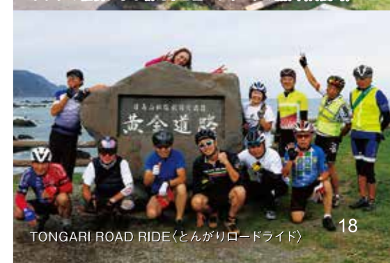
TONGARI ROAD RIDE(とんがりロードライド)