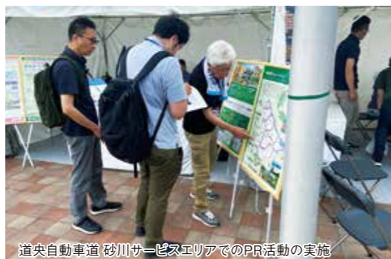
道央自動車道 砂川サービスエリアでのPR活動の実施