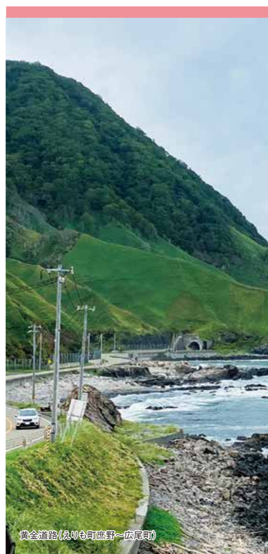
黄金道路(えりも町庶野~広尾町)