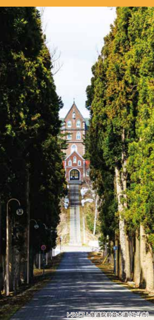
トリス修道院前並木道(北斗市)