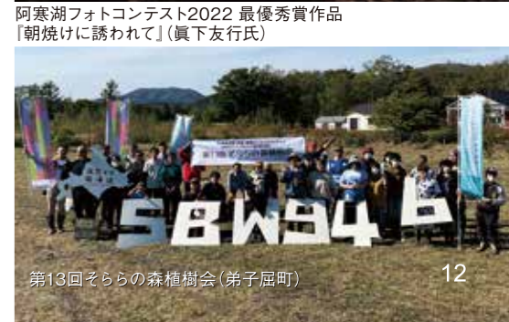
第13回そらの森植樹会(弟子屈町)