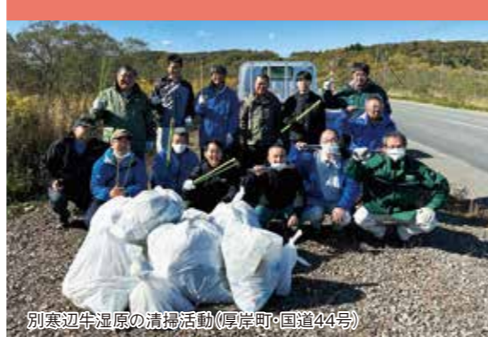
別寒辺牛湿原の清掃活動(厚岸町・国道44号)