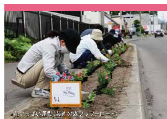
花いっぱい運動(芸術の森フラワーロード)