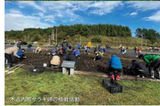
木古内町サラキ岬の植栽活動