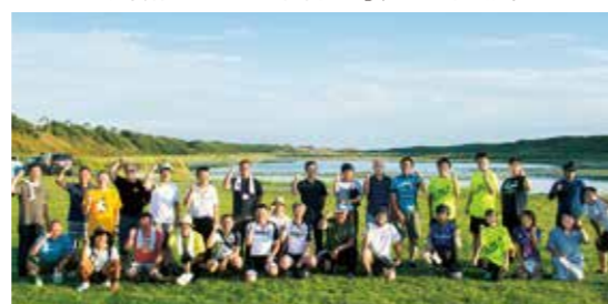
オロロンライン・サンセット・ミーティング[OSM](天塩町鏡沼)