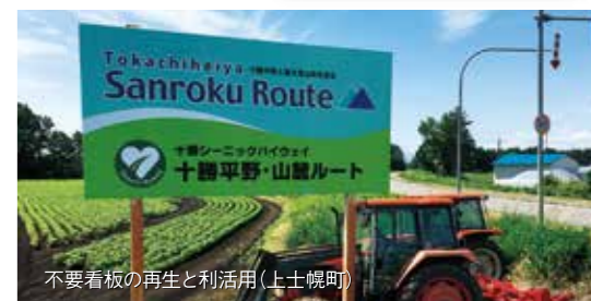
不要看板の再生と利活用(上士幌町)