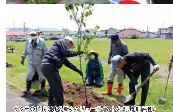
サクラの植樹による新たなビューポイントの創出(日高町)