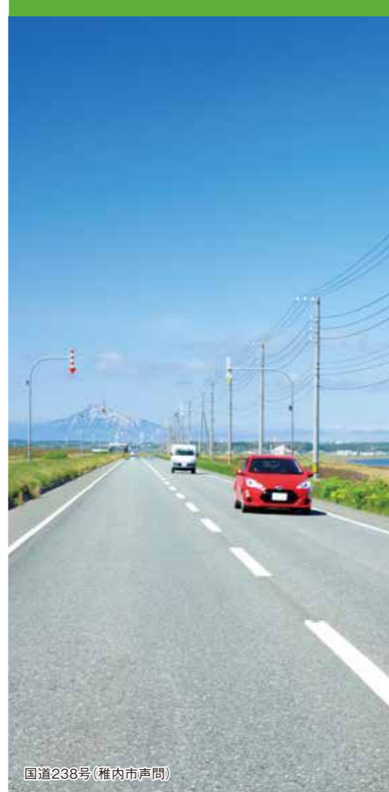
国道238号(稚内市声間)