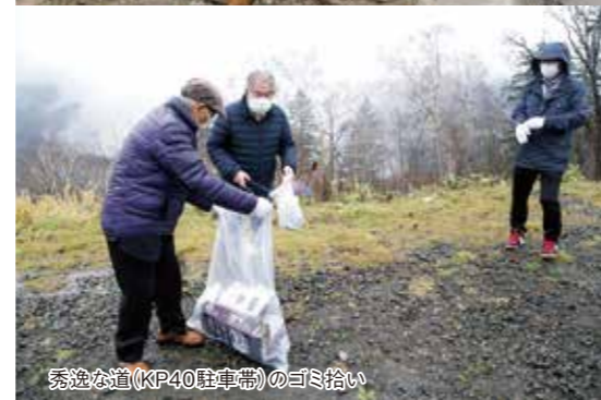
秀逸な道(KP40駐車帯)のゴミ拾い