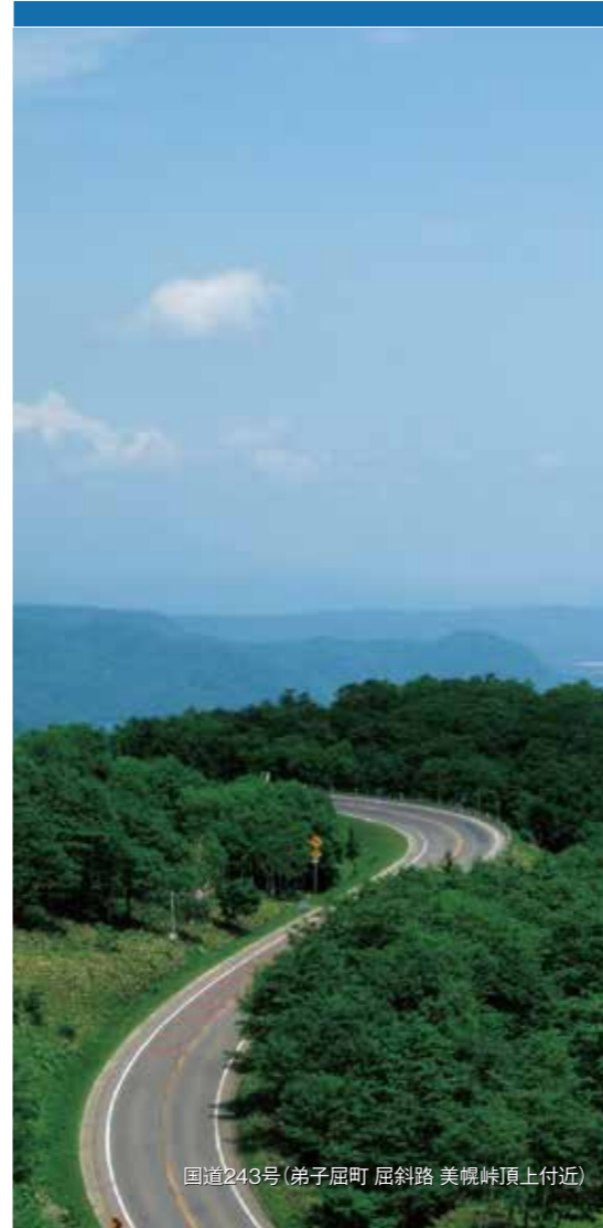
国道243号(弟子屈町 屈斜路 美幌峠頂上付近)