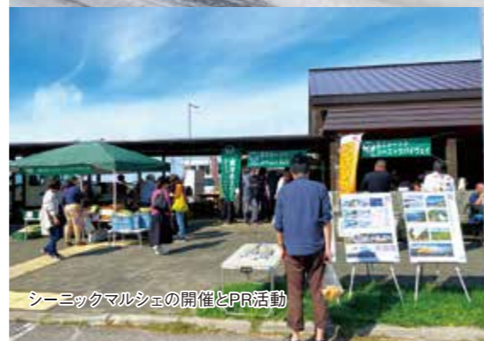
シーニックマルシェの開催とPR活動