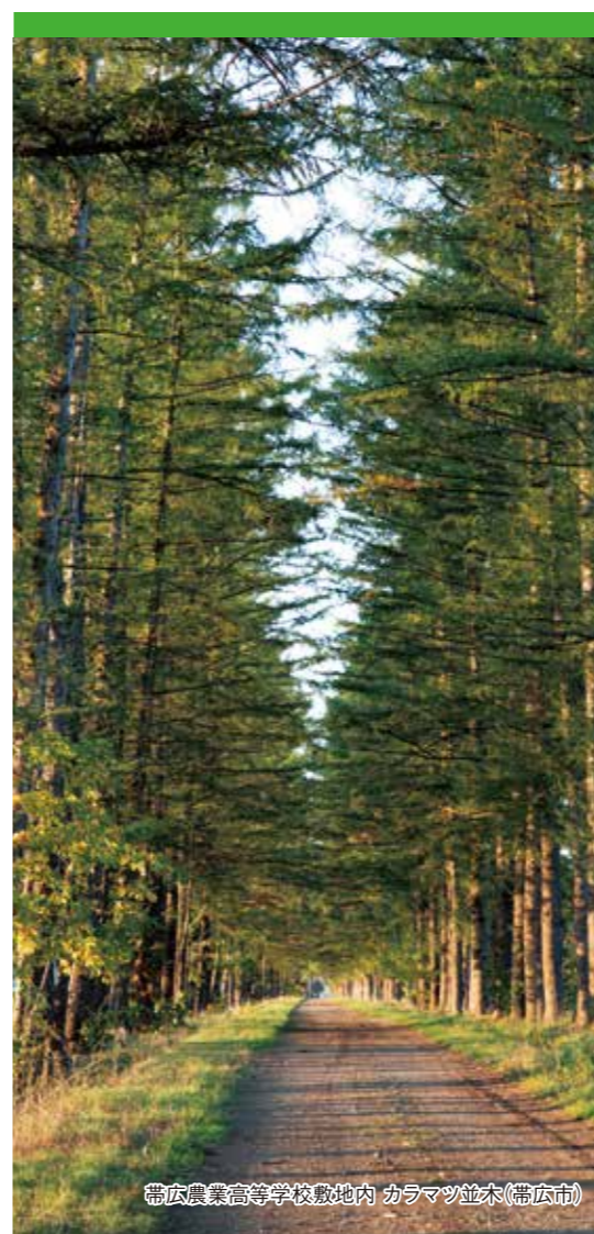
帯広農業高等学校敷地内 カラマツ並木(帯広市)