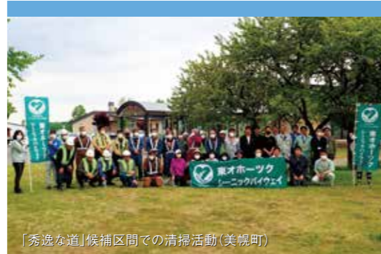
「秀逸な道」候補区間での清掃活動(美幌町)