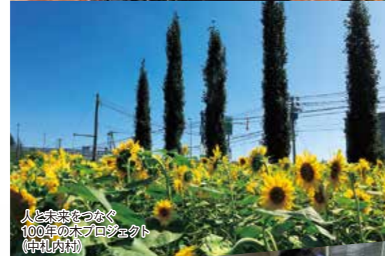
人と未来をつなぐ100年の木プロジェクト(中札内村)