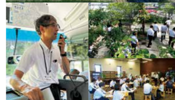
シーニックキャラバン@南空知(栗山町・由仁町・長沼町・南幌町)