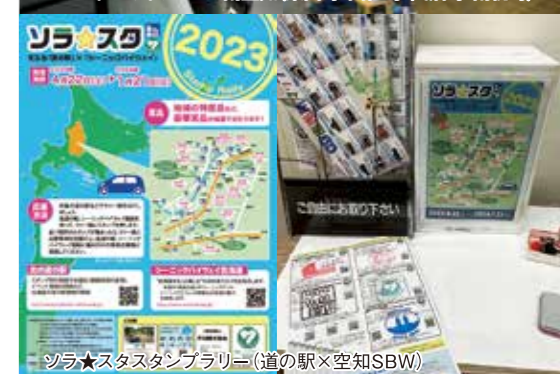
ソラ★スタスタジブラリー(道の駅×空知SBW)