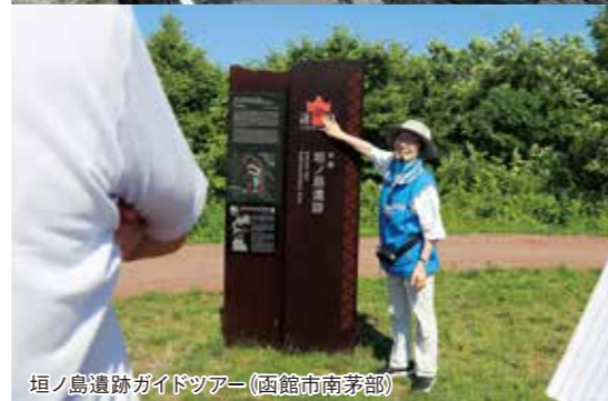
垣ノ島遺跡ガイドツアー(函館市南茅部)