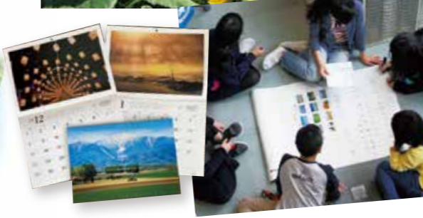
左:フォトコンテストカレンダー2024 右:学校シーニックバイウェイ2019(中札内村)