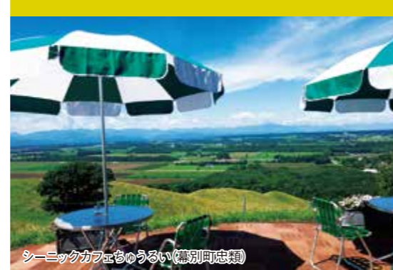
シーニックカフェちゅうるい(幕別町忠類)