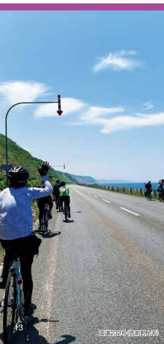
国道232号(苫前町上平)