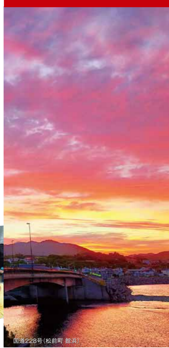
国道228号(松前町 館浜)