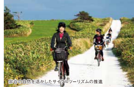
宗谷の自然を活かしたサイクルツーリズムの推進