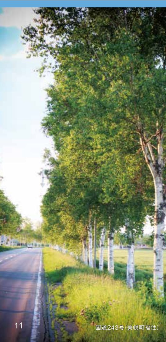
国道243号(美幌町福住)