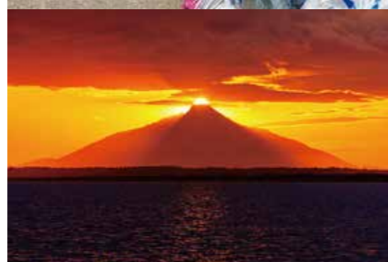
シーニックバイウェイ北海道北ルート連携フォトコンテスト2023 グランプリ受賞作品「天と地の隙間から」