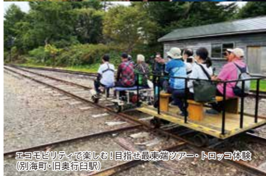
エコモビリティで楽しむ! 目指せ最東端ツアー・トロッコ体験(別海町・旧奥行自駅)