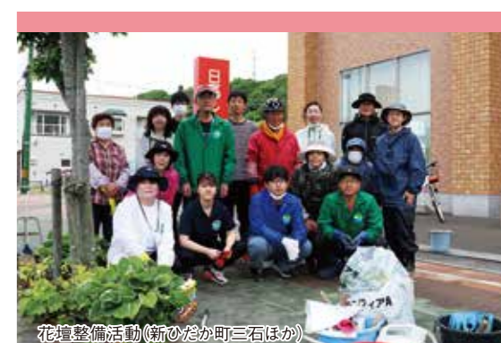
花壇整備活動(新ひだか町三石ほか)