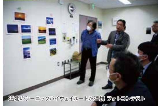
道北のシーニックバイウェイルートが連携 フォトコンテスト