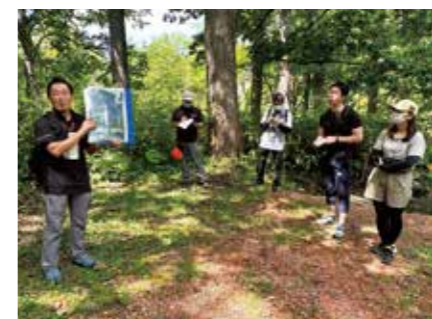
空知シーニックバイウェイ×三笠ジオパークジオツアー(三笠市)