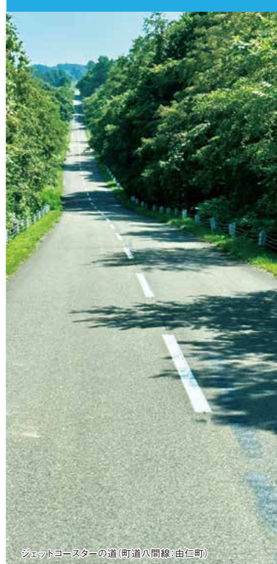
ジェットコースターの道(町道八間線:由仁町)