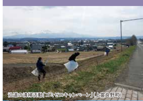
沿道の清掃活動「ゴミゼロキャンペーン」(上富良野町)