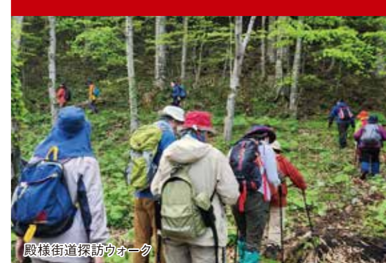
殿様街道探訪ウォーク