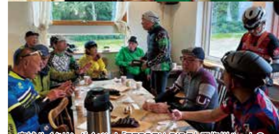
広域サイクリングイベント「TEPPEN-RIDE」天塩川ルートの「シーニック・カフェ」で休憩(宗谷SBWとの連携事業)