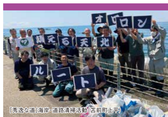
「秀逸な道」海岸・道路清掃活動(苫前町上平)