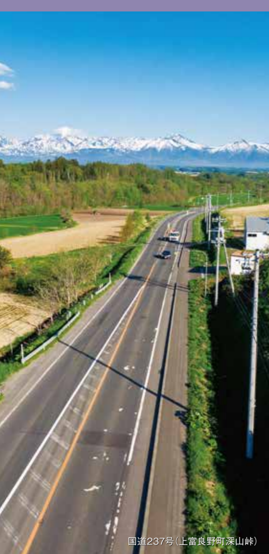
国道237号(上富良野町深山峠)