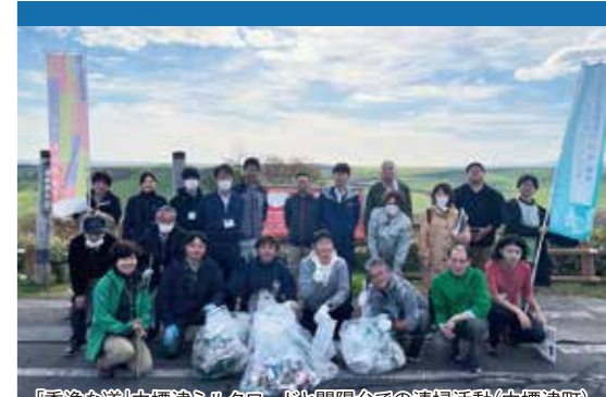
「秀逸な道」中標津シルクロードと開陽台での清掃活動(中標津町)