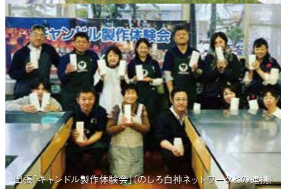
出張「キャンドル製作体験会」(のしる白神ネットワークとの連携)