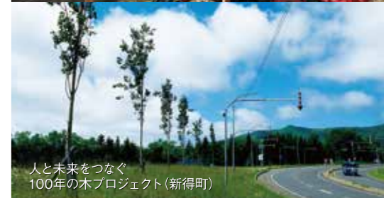
人と未来をつなぐ 100年の木プロジェクト(新得町)