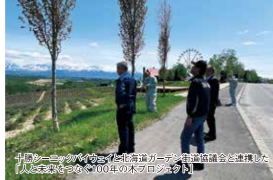
十勝シーニックバイウェイと北海道ガーデン街道協議会と連携した「人と未来をつなぐ100年の木プロジェクト」