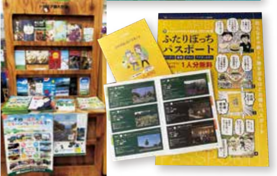
上:トカプチマップ2023 左:情報ボックス 右:ふたりぼっちパスポート2023