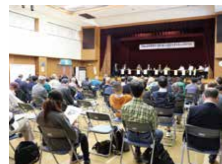
日高山脈襟裳国定公園の国立公園化を考えるシンポジウム