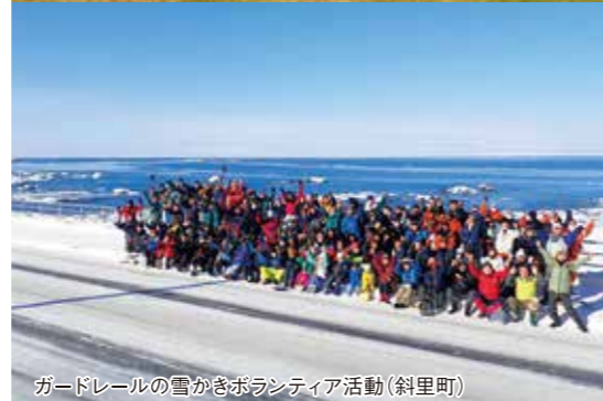
ガードレールの雪かきボランティア活動(斜里町)