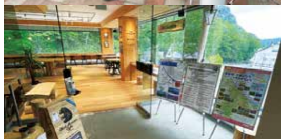
美しい景観が望める「シーニックカフェ」の登録(上川町・紋別市)