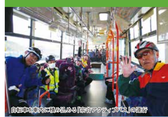
自転車を車内に積み込める「宗谷アクティブバス」の運行