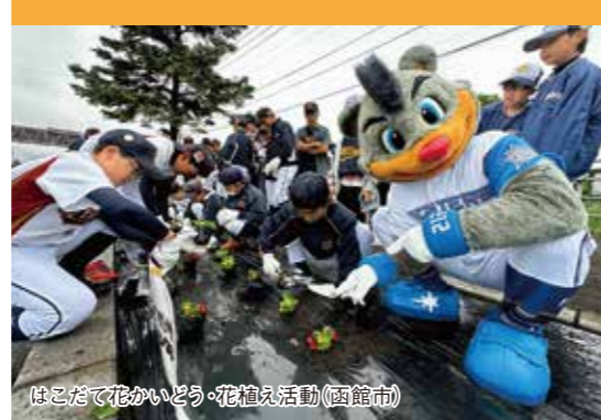
はこだて花かいどう・花植え活動(函館市)