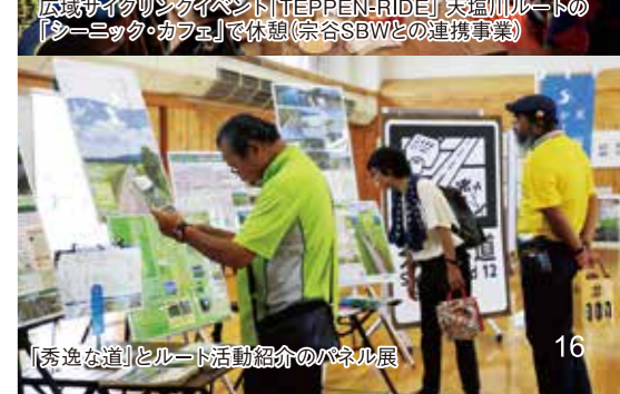
「秀逸な道」とルート活動紹介のパネル展