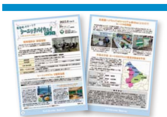
ルート情報を発信するニュースレターの発行