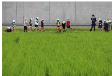
田んぼの生き物調査