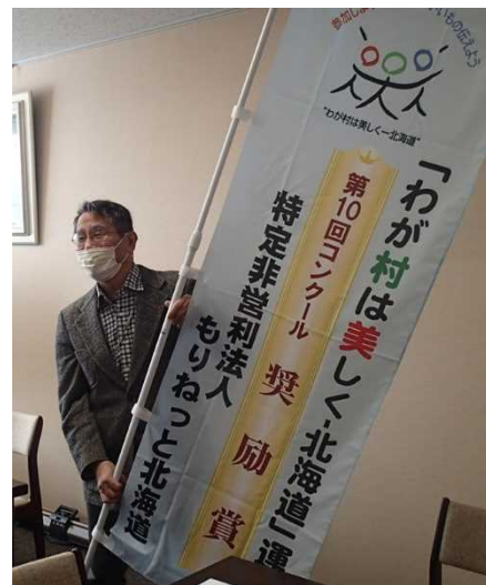
【奨励賞】特定非営利法人 もりねっと北海道