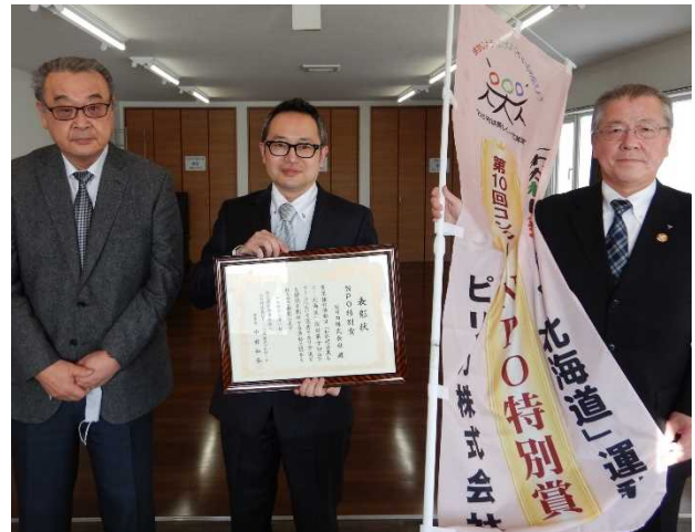
【NPO 特別賞】ピリカ株式会社