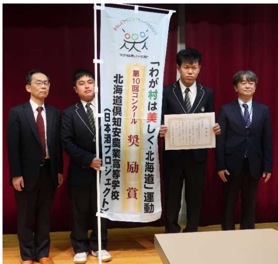
【奨励賞】北海道倶知安農業高等学校 (日本酒プロジェクト)