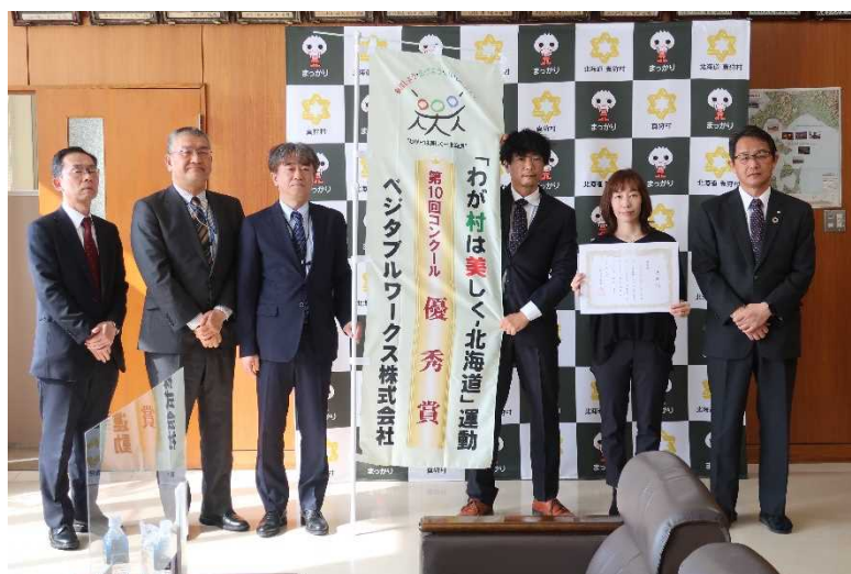
【優秀賞】ベジタブルワークス株式会社