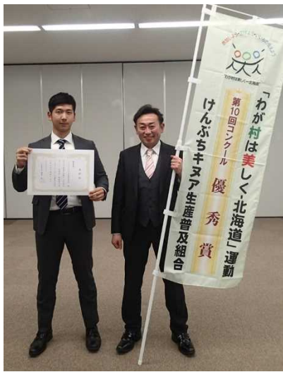
【優秀賞】けんぶちキヌア生産普及組合