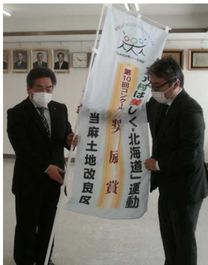
【奨励賞】当麻土地改良区