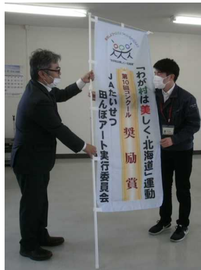
【奨励賞】JAたいせつ田んぼアート実行委員会