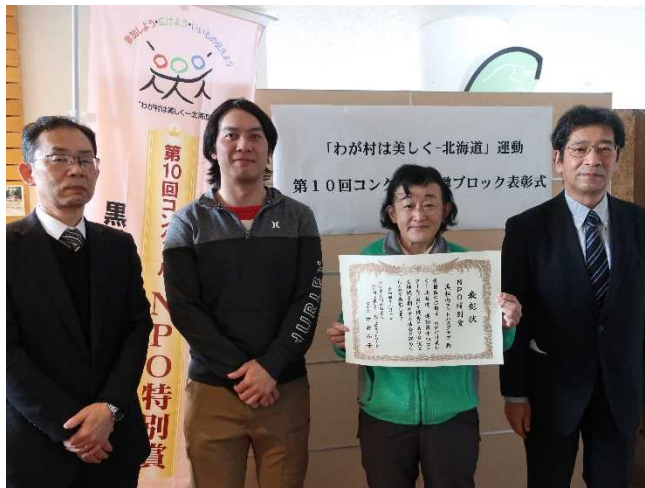
【NPO 特別賞】黒松内フットパスクラブ