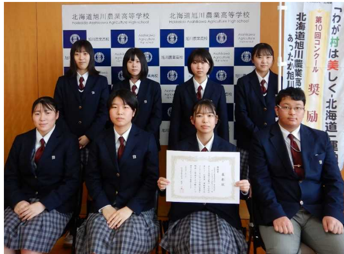
【奨励賞】北海道旭川農業高等学校食品科学科 あったか旭川まん研究グループ