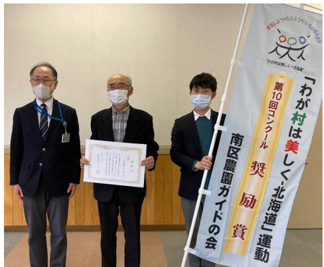
【奨励賞】南区農園ガイドの会