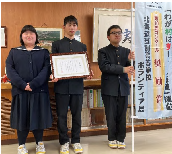
【奨励賞】北海道当別高等学校 ボランティア局