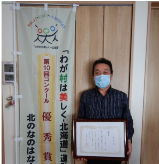
【優秀賞】北のなのはな会