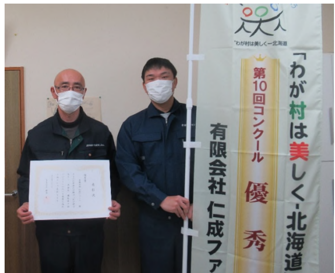
【優秀賞】有限会社 仁成ファーム