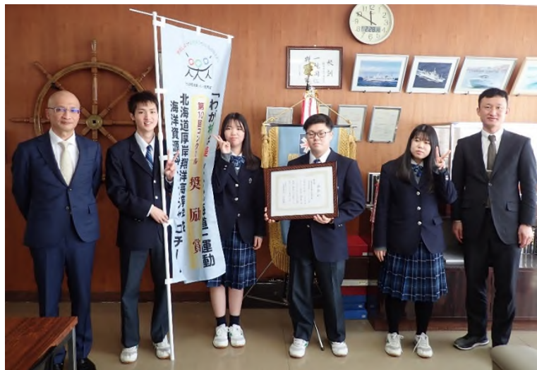
【奨励賞】北海道厚岸翔洋高等学校 海洋資源科 アナジャコチーム