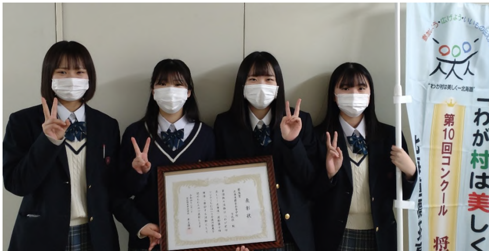
【奨励賞】北海道標茶高等学校 牛乳班