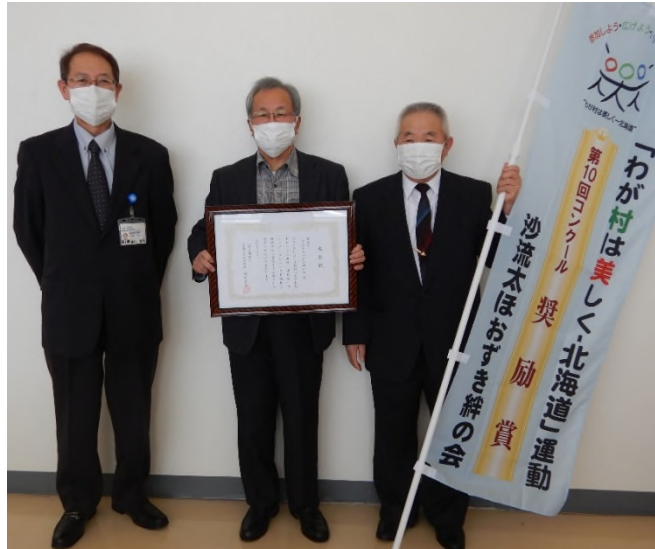
【奨励賞】沙流太ほおずき絆の会