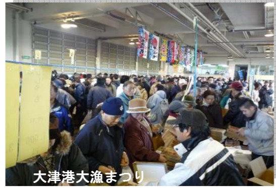
大津港大漁まつり