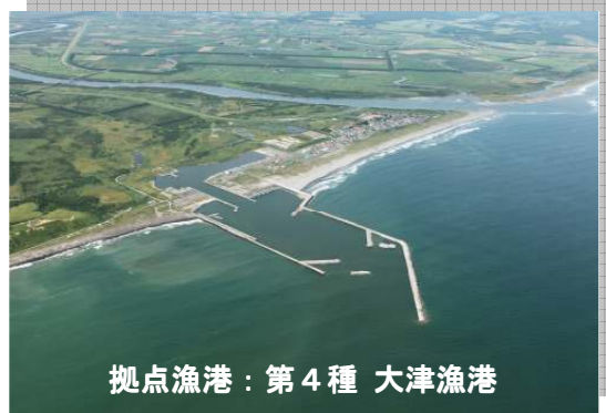
拠点漁港：第4種 大津漁港