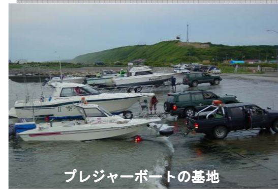
プレジャーボートの基地