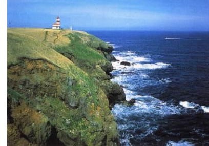
独自の自然環境・景観 (落石岬・海岸線)