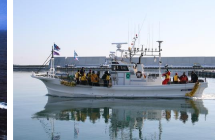
ネイチャークルーズ (自然共生型エコ・ツーリズム)