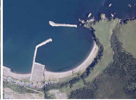
落石漁港(浜松地区)