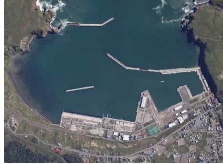
落石漁港(落石地区)