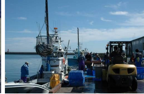
漁獲水産物の陸揚げ