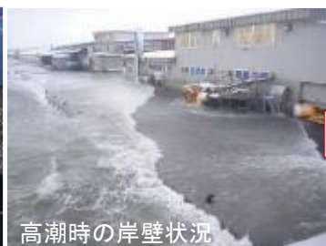
高潮時の岸壁状況