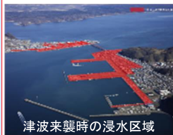
津波来襲時の浸水区域