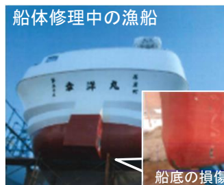
船体修理中の漁船