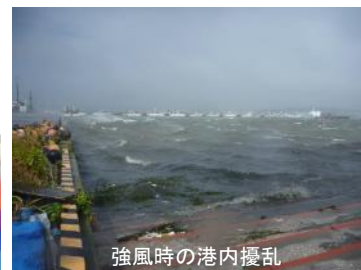
強風時の港内擾乱