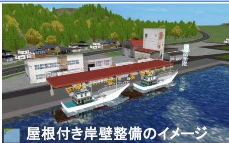
屋根付き岸壁整備のイメージ