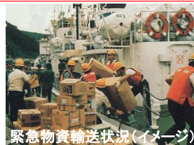
緊急物資輸送状況(イメージ)