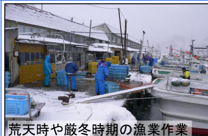
荒天時や厳冬時期の漁業作業