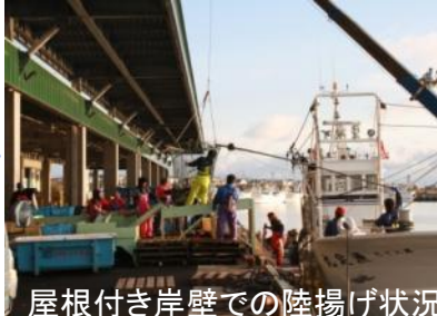
屋根付き岸壁での陸揚げ状況