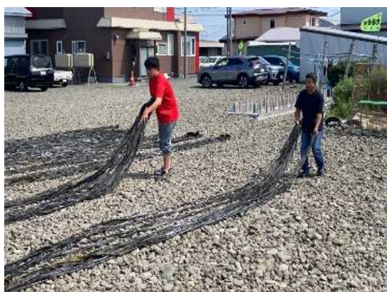
学生による昆布干し作業

この取組は、歯舞地域と大学の双方にメリットが得られるものとなっているほか、地域の魅力の発信や交流人口の拡大、若年層への水産業の理解向上、担い手不足への対応も図られる事業内容であり、これらの取組が高く評価され、優良賞に選定されました。