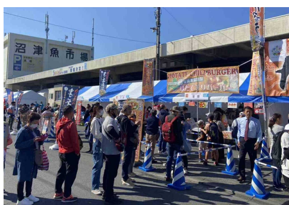
ほたてチリバーガー販売時の行列