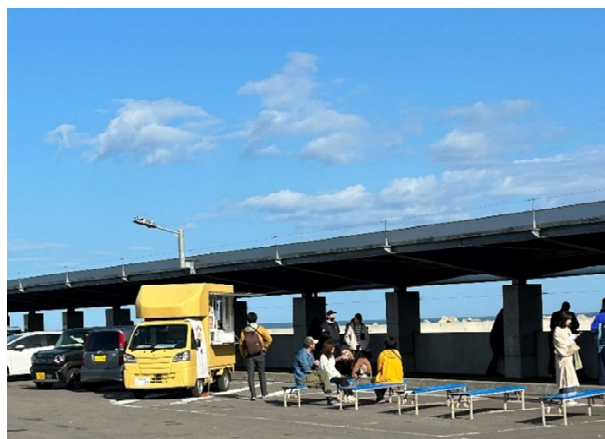
ウトロ鮭テラスでのキッチンカー試験出店