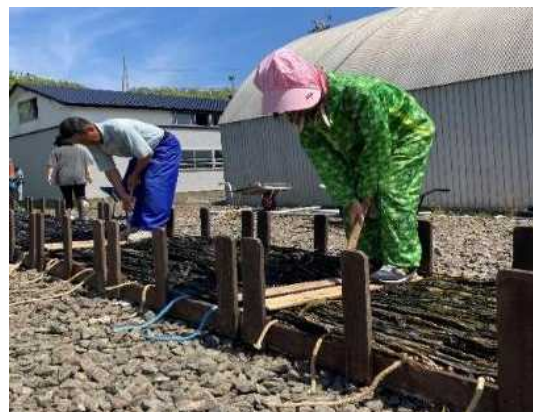
学生による昆布裁断作業