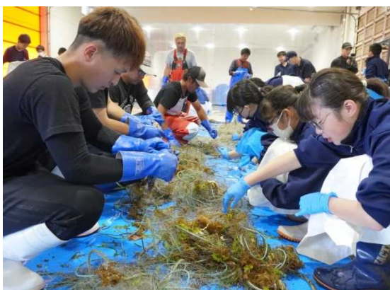
若手漁業者による体験授業

若手漁業者の熱意と積極的なPRにより、今後、更なる取組の発展が期待されるため、奨励賞に選定されました。