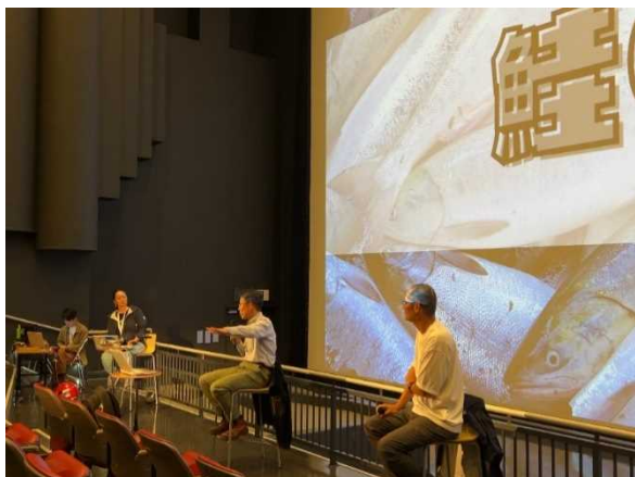
鮭のトークショー

このような地元観光産業と連携した取組は、漁港施設の観光への活用、地域資源の情報発信の模範となる取組であり、また、取組のステップアップが図られていることから、最優良賞に選定されました。