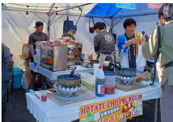
協議会メンバーによる販売風景

この取組は、地域で協力して開発した商品を通じて、地元産水産物の消費促進や知名度の向上を図った事例で、他地域の模範となる取組であると評価され、優良賞に選定されました。