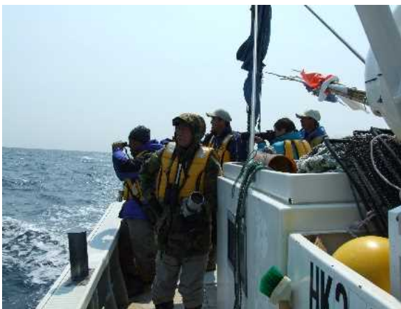
落石ネイチャークルーズ

これらの取組は、地域ならではの自然を生かした漁村の魅力発信の好事例として、また、地域の人材育成にも努めていることが高く評価され、優良賞に選定されました。