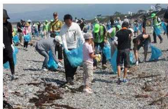
海岸環境の維持 (清掃活動)