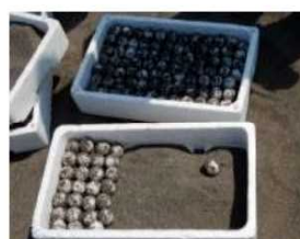
希少種保護 (ウミガメ卵の保護)