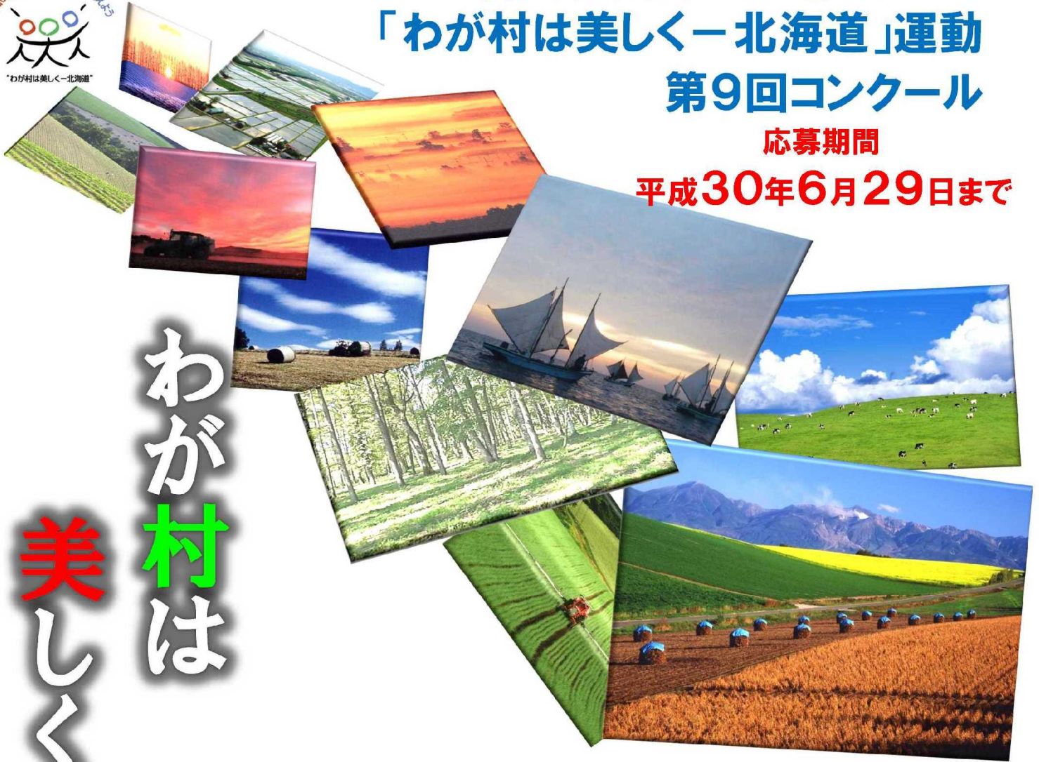
背景写真：(一社)北海道土地改良設計技術協会主催「北の農村フォトコンテスト」応募作品