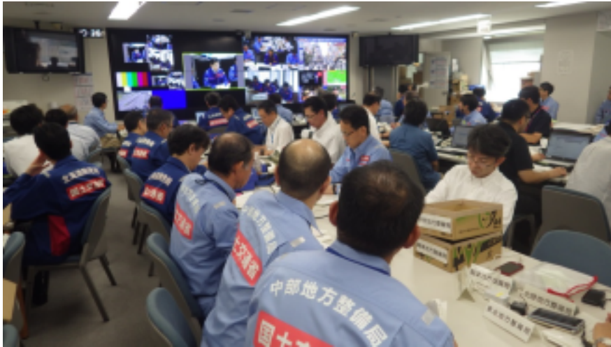
第5回災害対策本部会議