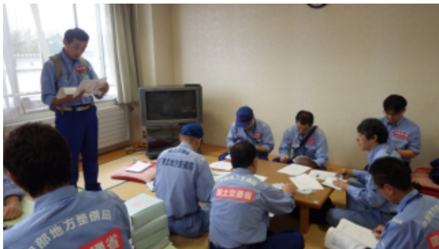
全体ミーティング