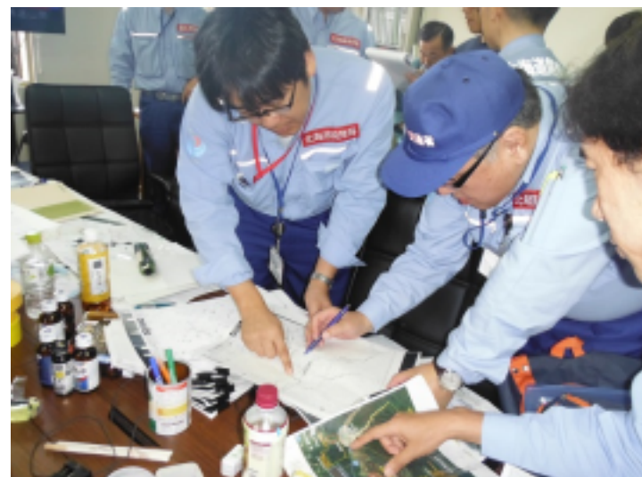
調査状況【留萌⑤班】(厚真町役場)