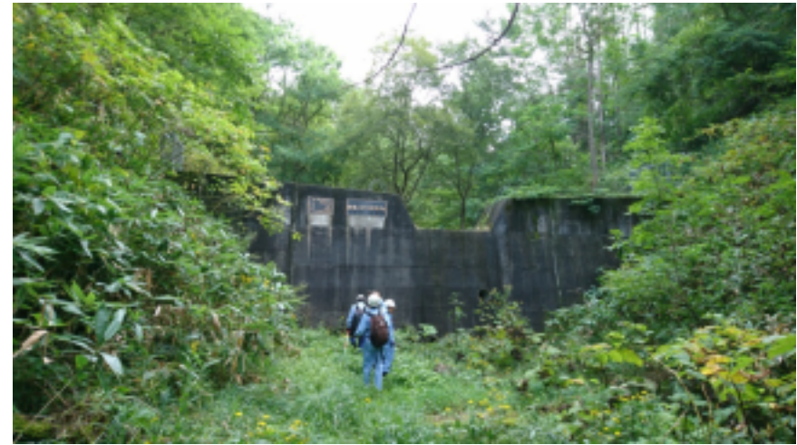
三笠市(新幌の沢川)の砂防調査の状況