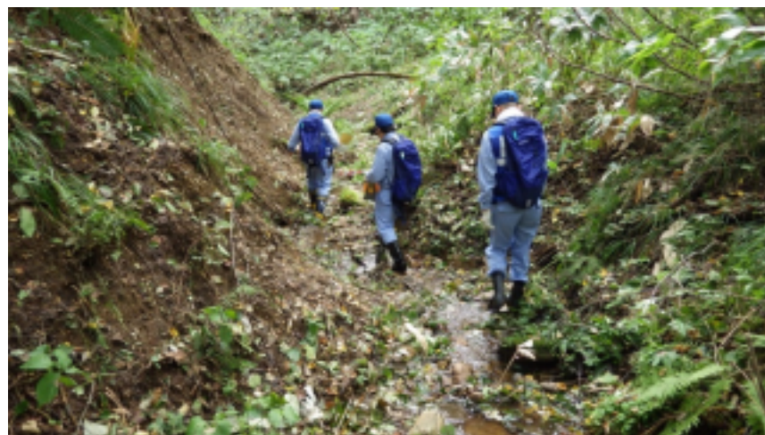
土砂災害危険箇所調査