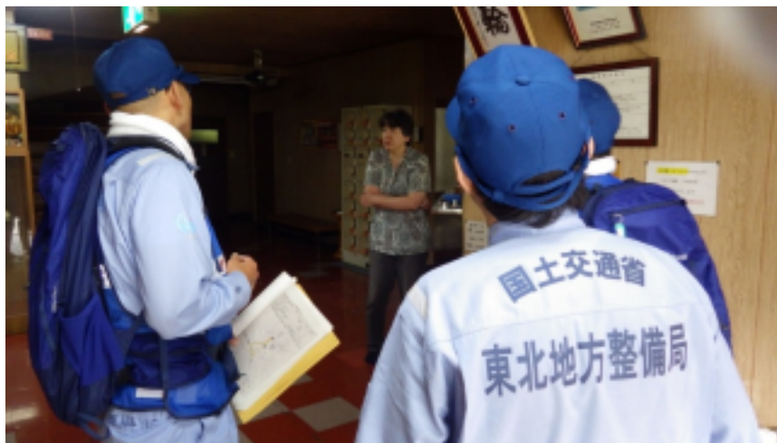
地元住民への聞き取り調査