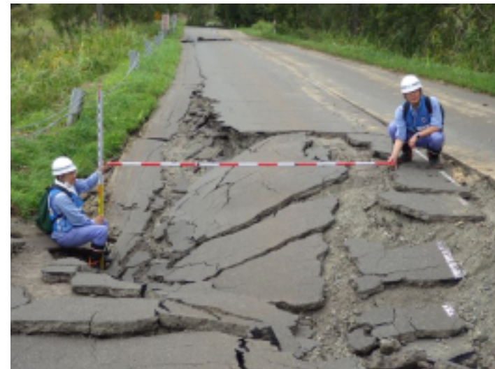
道路②班 (厚真町幌里地区)