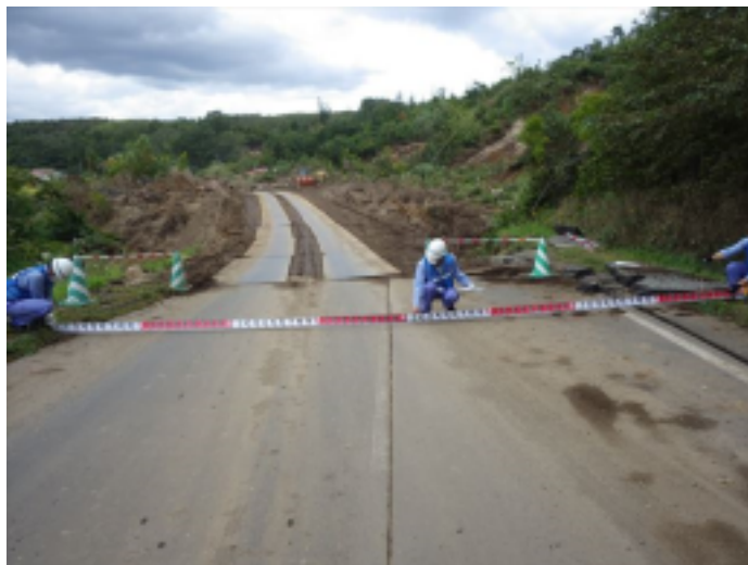
道路①班 (厚真町吉野地区)