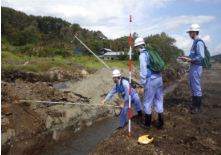
河川①班 (チカエップ川 厚真町吉野・富里地区)