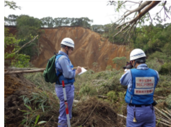
砂防①班写真 (知決辺川 厚真町幌里地区)