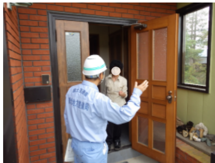
被災状況について地元の方へのヒアリング