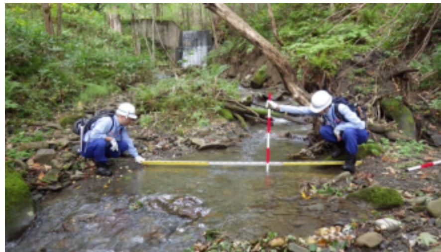
三笠市(幾春別川)の砂防調査の状況