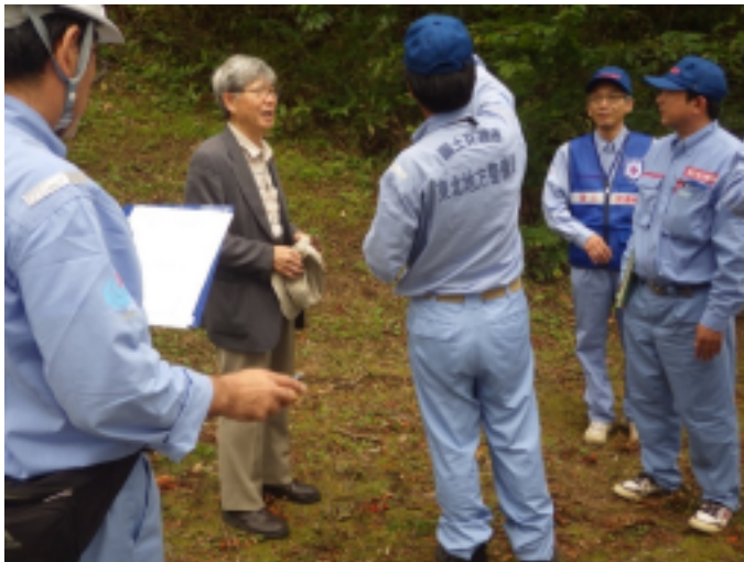
施設管理者へ状況説明(お礼あり)