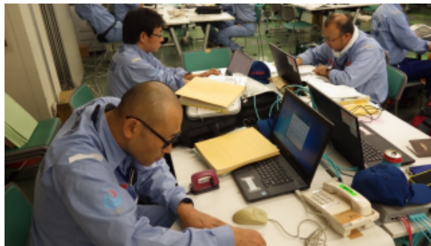
調査結果取りまとめ状況