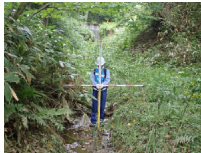
三笠市の砂防調査(土砂災害危険箇所等)の状況