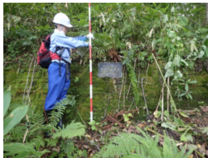
三笠市の砂防調査(土砂災害危険箇所等)の状況