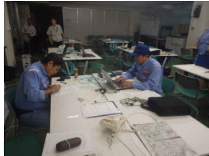
調査結果取りまとめ状況