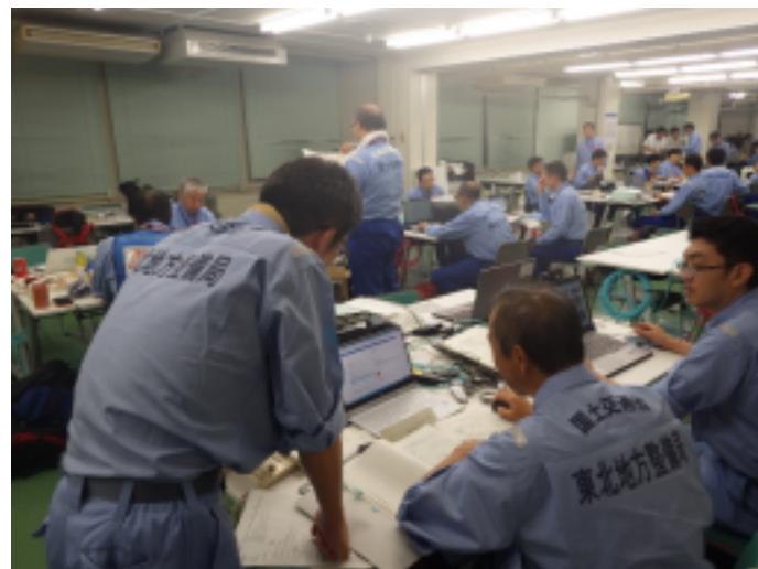
調査結果取りまとめ状況