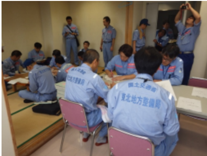
北海道開発局との班長会議(苫東中央管理ST)