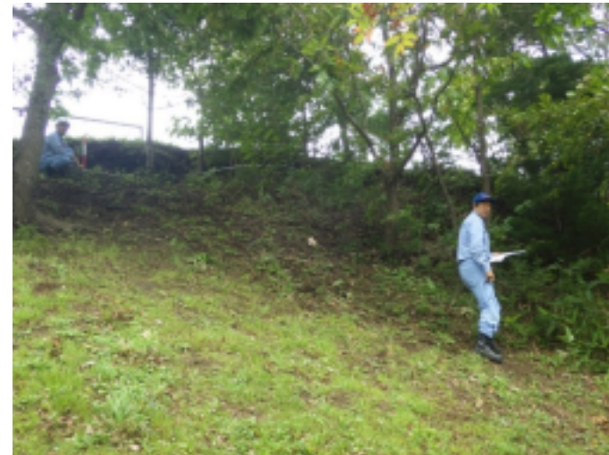
急傾斜地 状況の調査