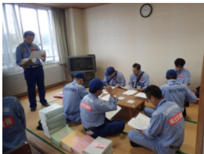
打ち合わせの様子