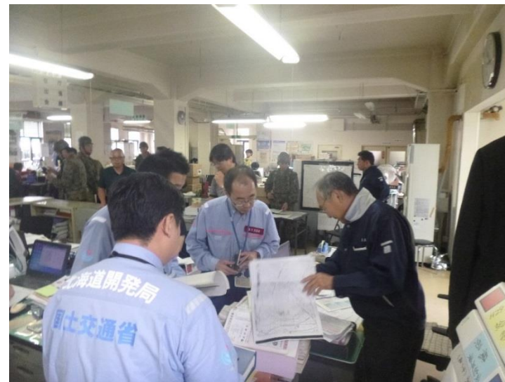
関係機関との協議・調整（厚真町）