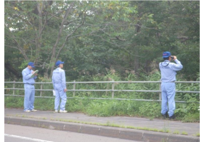
急傾斜地 状況の調査