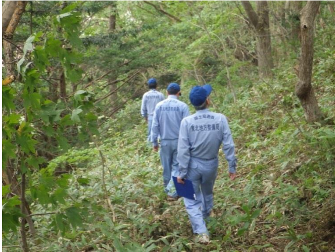
急傾斜地 状況の調査