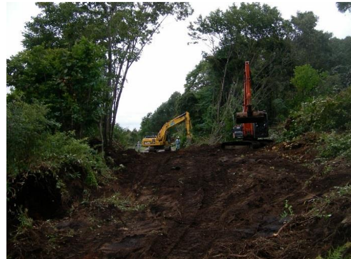
幌里地区（町道幌里本線）啓開作業状況