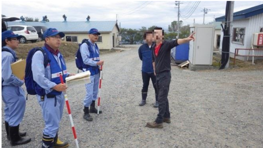
地元住民への聞き取り調査