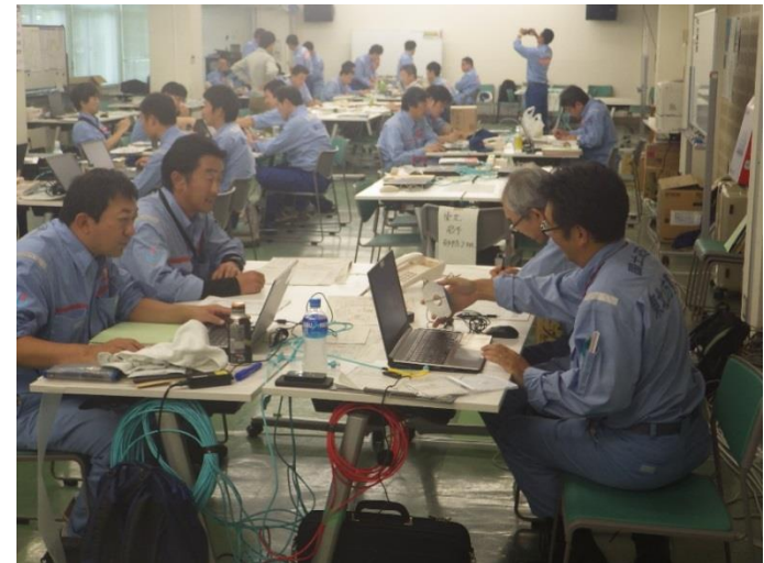
調査結果取りまとめ状況