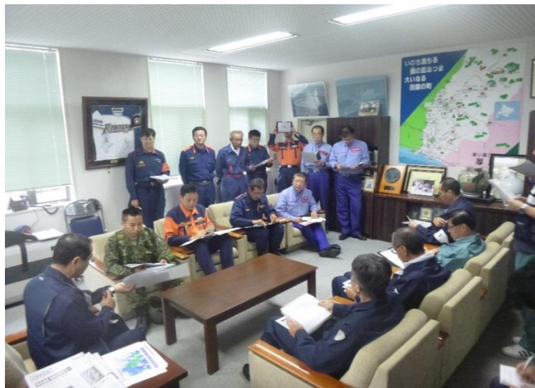
関係機関代表者会議（厚真町長室）