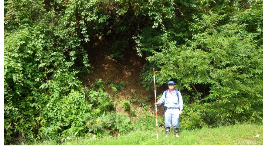
急傾斜地崩落危険箇所調査