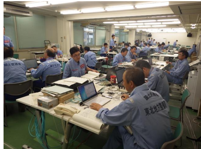
調査結果取りまとめ状況