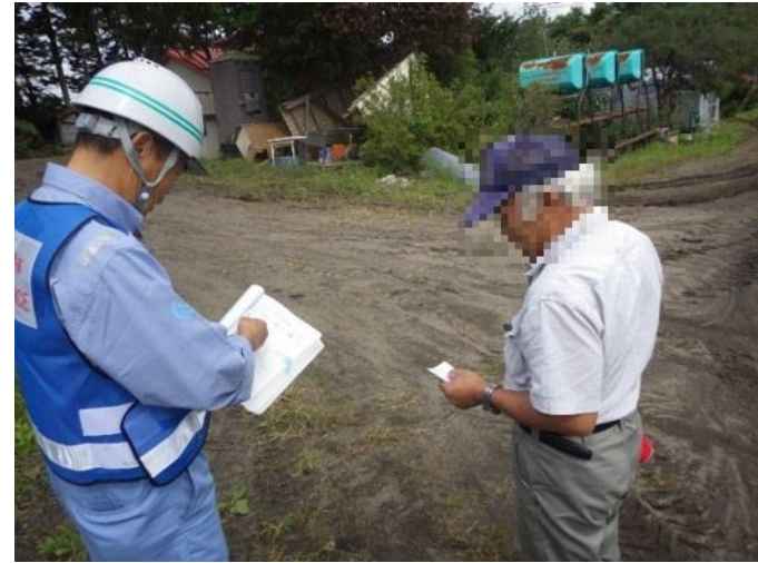
被災状況について地元の方へのヒアリング