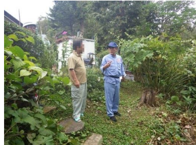
被害状況について地元の方へヒアリング