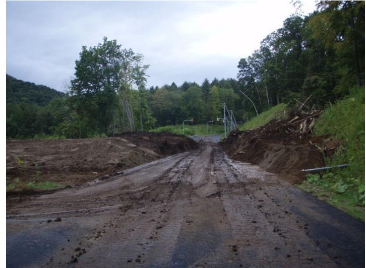
厚真ダム（道道上幌内早来停車場線）啓開作業状況