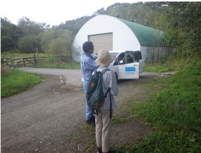
地権者へ状況説明