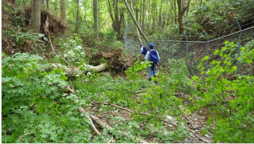
土石流危険溪流調査