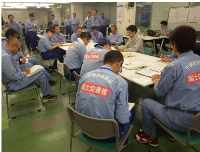
札幌開発建設部 班長ミーティング状況