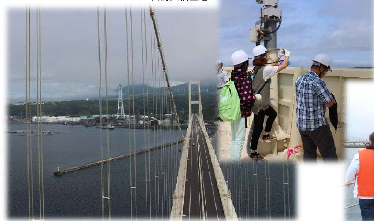
天気が良ければ左前方に有珠山、羊蹄山も・・・