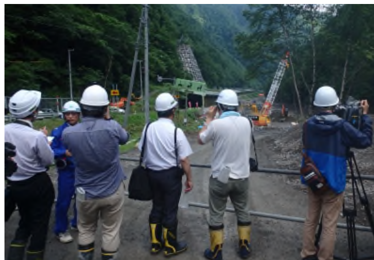
参加報道機関15社に対し復旧作業状況について説明(日高道路事務所 高田所長)