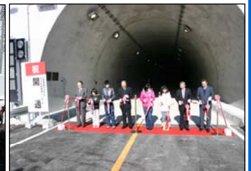
H24.1.28 目黒トンネル開通式