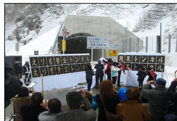
H23.1.30 えりも黄金トンネル銘板 除幕式