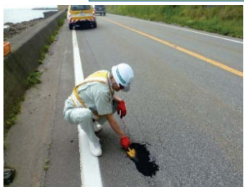
路面上に穴を発見した場合、アスファルト合材で補修