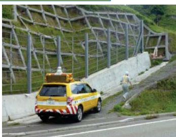
車から降り、目視で法面を点検