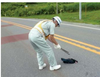
道路上の落下物(カラスの死骸)を撤去