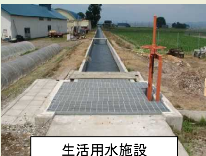
生活用水施設 (二期:豊川用水路)