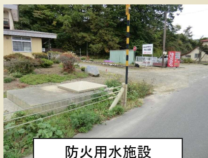
防火用水施設 (二期:3区用水路)