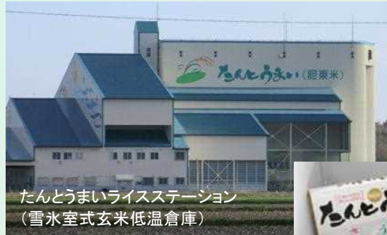
たんとうまいライスステーション (雪氷室式玄米低温倉庫)