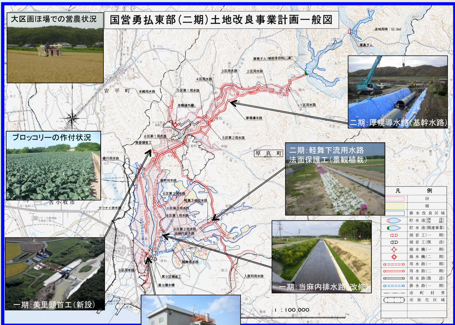
国営勇払東部(二期)土地改良事業計画一般図