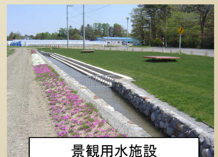
景観用水施設 (二期:軽舞下流用水路)