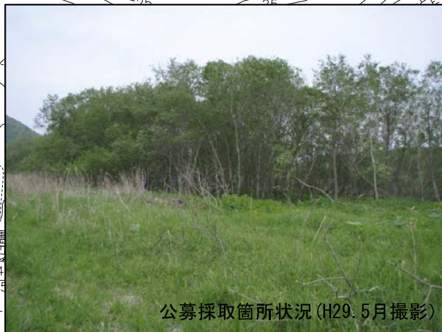
公募採取箇所状況 (H29. 5月撮影)