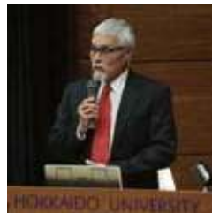
北海道大学国際連携研究教育局 教授 ジョー・ワトキンス氏

先住民族考古学／人権としての文化遺産、 文化盗用問題などが専門 北海道大学国際連携研究教育局先住民・文化的多様性研究グローバルステーション教授(兼任) カナダ連邦サイモンフレイザー大学考古学部長・教授 文化遺産における知的財産権問題プロジェクト(IPinCH)などの学際的・国際的事業を、アイヌ民族をふくむ世界各地の先住民族との協働を重視しながら続けてきた。