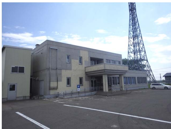
図-2 十勝清水防災ステーション 外観