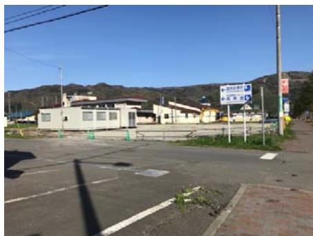
図-2 インフォメーションセンター外観