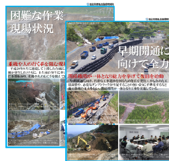
図-4 掲示予定のパネル