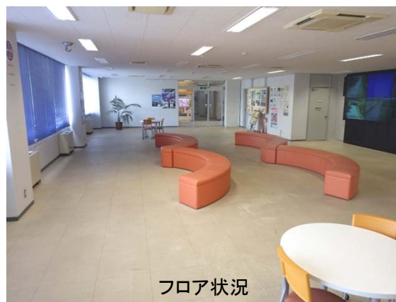
図-3 十勝清水防災ステーション 内部