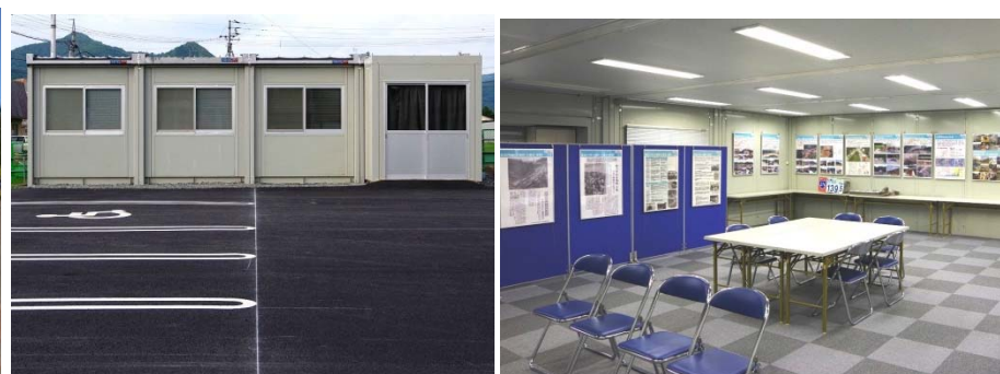
図-3 インフォメーションセンター内部