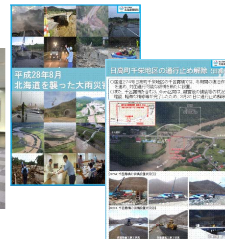
図-4 掲示予定のパネル