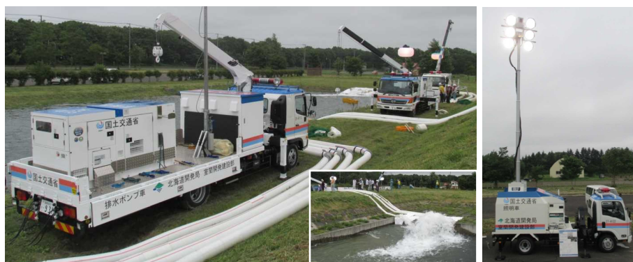
室蘭開発建設部災害対策用機械操作訓練 実施状況