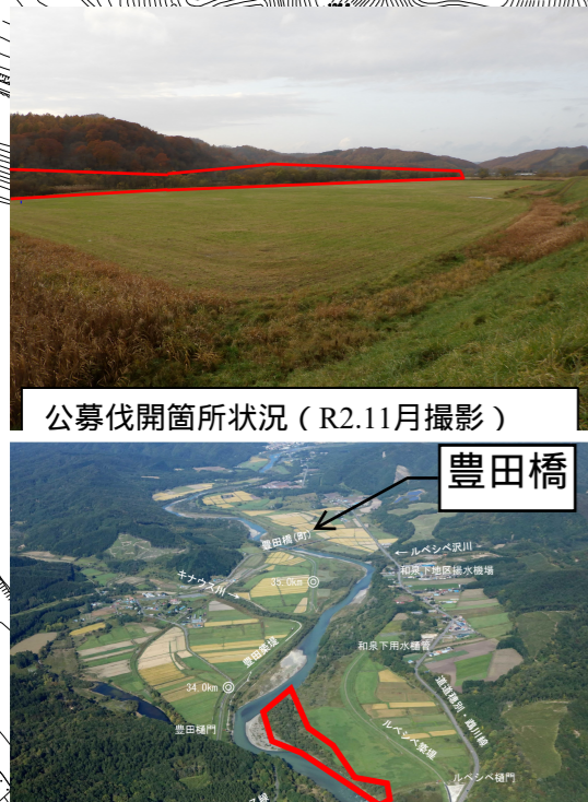
公募伐開箇所状況 (R2.11月撮影)