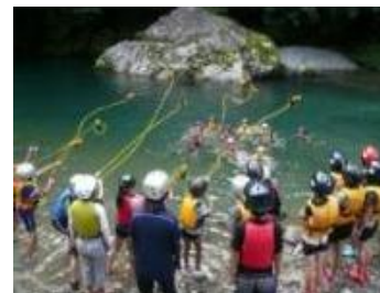
水辺の安全利用講習