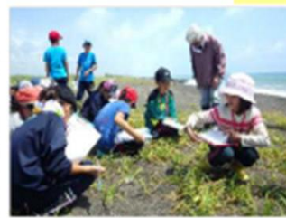
環境教育活動 [北海道：胆振海岸]