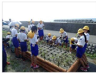
海浜植物の植栽・保護 [富山県：下新川海岸]