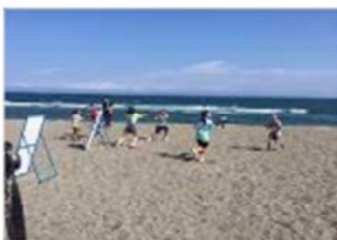
海岸PR活動（水鉄砲大会） [高知県：高知海岸]