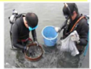
生物育成環境モニタリング [兵庫県：東播海岸]