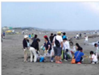
海岸清掃活動 [新潟県：新潟海岸]

これらの活動は海岸管理の充実にも寄与し、海岸管理の担い手として位置付け、海岸管理者が情報提供、技術的支援を行うことにより連携を強化