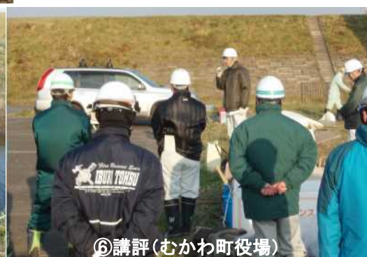
⑥講評(むかわ町役場)