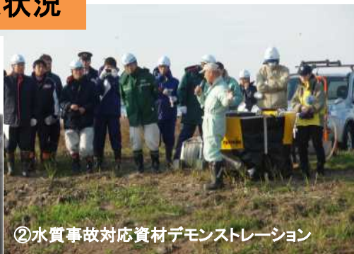
②水質事故対応資材デモンストレーション