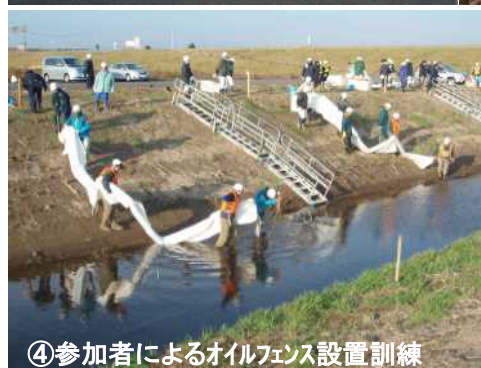
④参加者によるオイルフェンス設置訓練