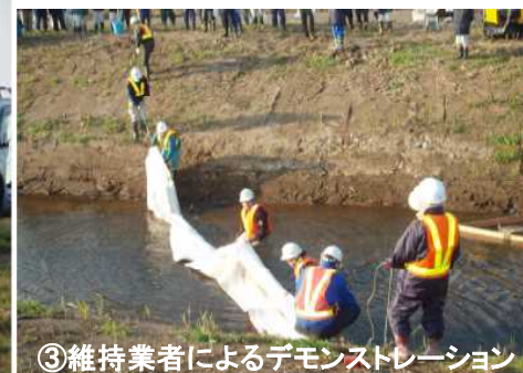
③維持業者によるデモンストレーション