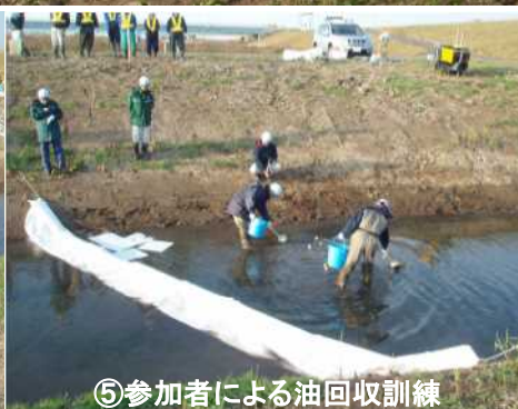
⑤参加者による油回収訓練