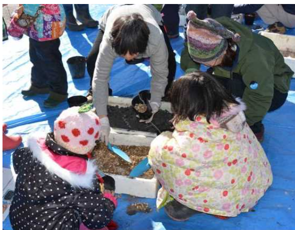
昨年度の観察会の様子（植樹用の苗作り）