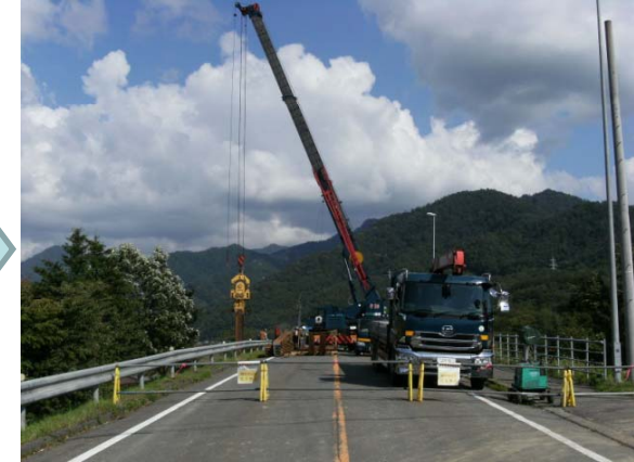
△道路洗掘防止状況(鋼矢板打設)(H28.9.2)