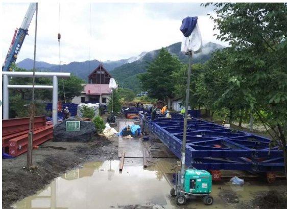
△復旧作業用仮橋組立状況(H28.9.6)