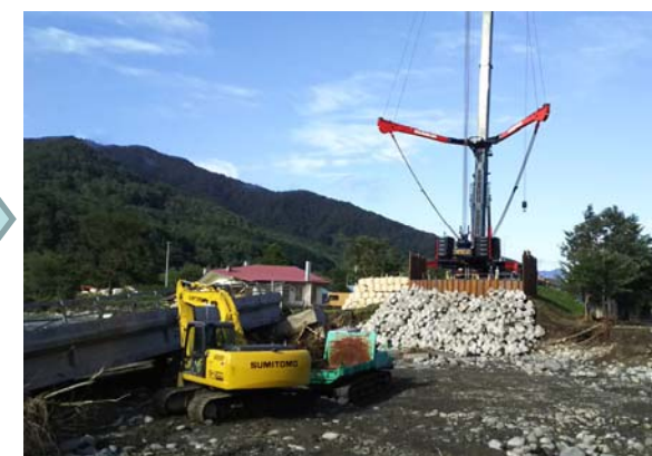
△復旧作業用仮橋架設用クレーン設置状況(H28.9.7)