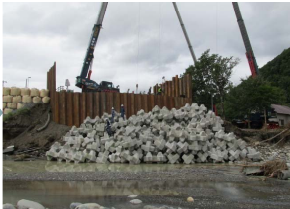
△道路洗掘防止工完了(H28.9.5)