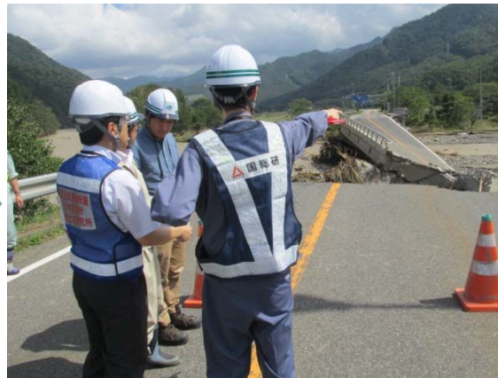
△国土技術政策総合研究所調査状況(H28.9.1)