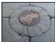
マンホール周辺の舗装に亀裂が発生