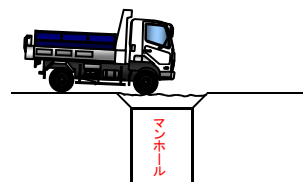
走行性が悪くなります。