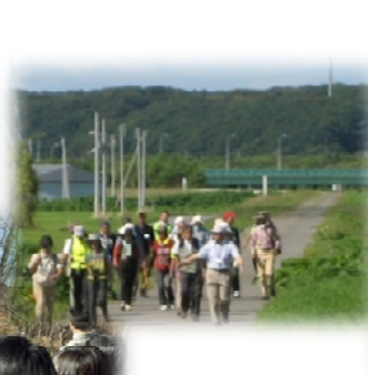
アイヌの自然観にふれる沙流川フットパスイベント、 歴史を伝える解説板（紫雲古津川向大橋付近）