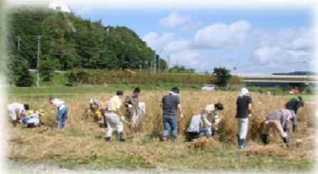
伝統的に水辺空間で採取・育成をして いた草本類植栽や雑穀栽培等の伝承活動