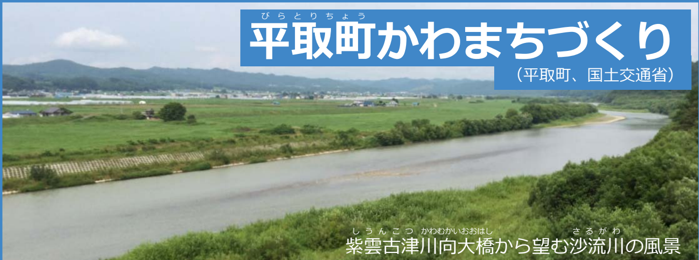
しうんこつ かわむかいおほし さるがわ 紫雲古津川向大橋から望む沙流川の風景