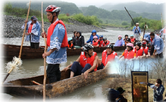
沙流川沿いで行われる 「チプサンケ」と呼ばれる 舟下ろしのアイヌ伝統文化