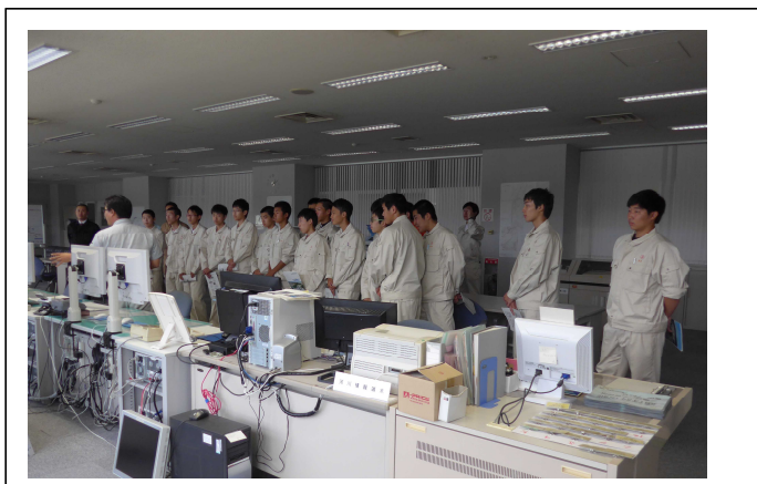
熱心に説明を聞く学生たち (昨年度の状況)