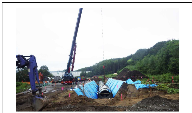
今年も導水路工事を見学予定です