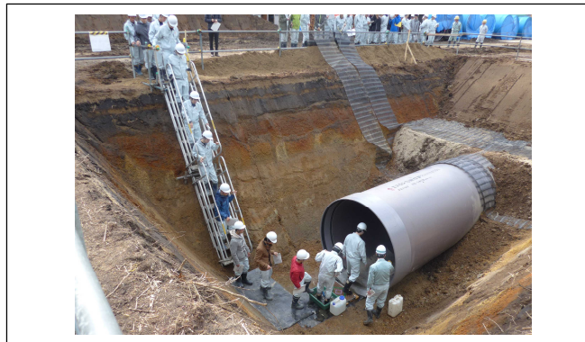
昨年の見学会の様子です。