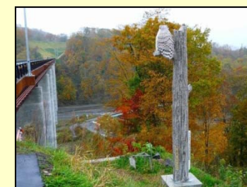
フクロウ・モニュメント