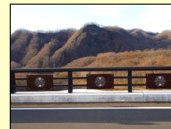
アイヌ文様表示板