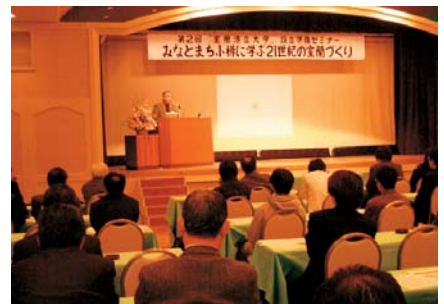
室蘭港立市民大学