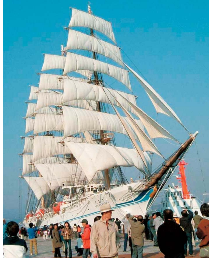
航海訓練所帆船「海王丸」寄港にあわせたシーサイドフェアの実施

さらに、室蘭港立市民大学を設立し、講演会やワークショップを開催し、まちづくりのための人材育成やネットワークづくりにも寄与しています。