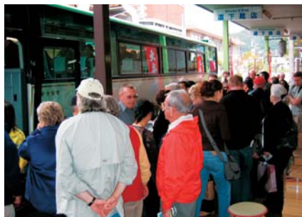
大型旅客船歓迎イベント