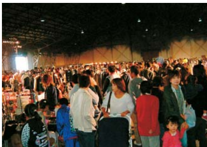
市営3号倉庫内でのフリーマーケット