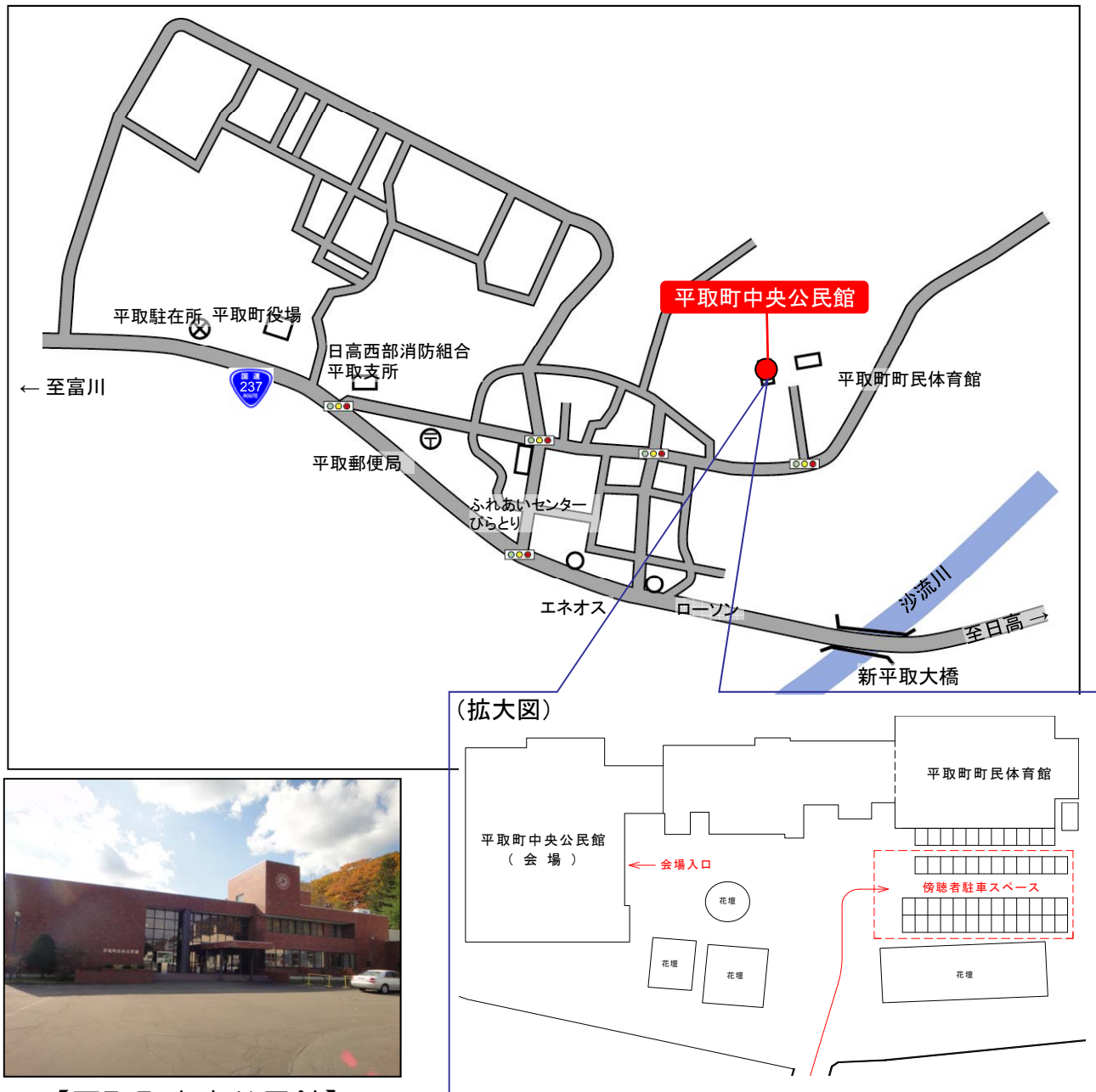
【平取町中央公民館】