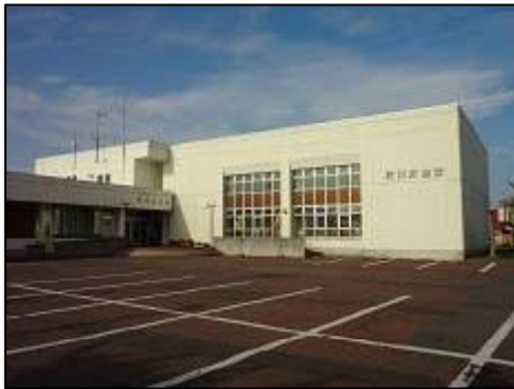
【日高町富川公会堂】