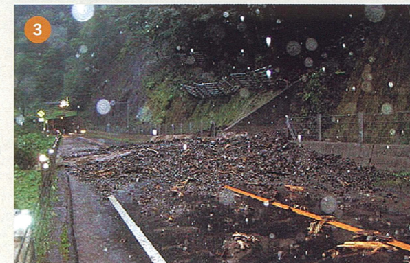
一般国道274号 日高町字千栄 土砂崩落

※一般国道235号慶能舞橋については、8月12日14:00緊急復旧終了、本復旧に向け調査中 ※その他の被災箇所については、8月14日9:30までに、ほぼ復旧作業を完了