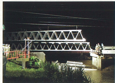
応急組立橋の架設状況

慶能舞川の増水により橋台が倒壊し、落橋した慶能舞橋。一般国道は、台風10号の大雨の影響により、道路への土砂流入、路肩の崩落や落橋など大きな被害を受け、その被害箇所は6路線57箇所及びました。北海道開発局は、一般国道235号慶能舞橋落橋に対する応急組立橋（防災・技術センター保有）の架設や崩落した土砂の除去等を速やかに行い、一般国道の早期通行確保に努めました。