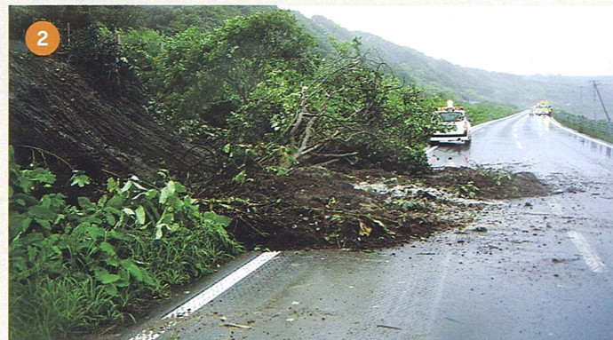
一般国道235号 門別町字賀張 土砂崩落