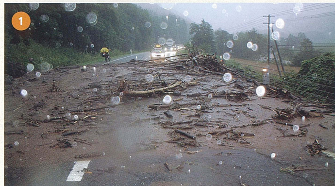
一般国道241号 足寄町上足寄 土砂崩落