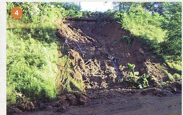
一般国道241号 本別町美里別 土砂崩落