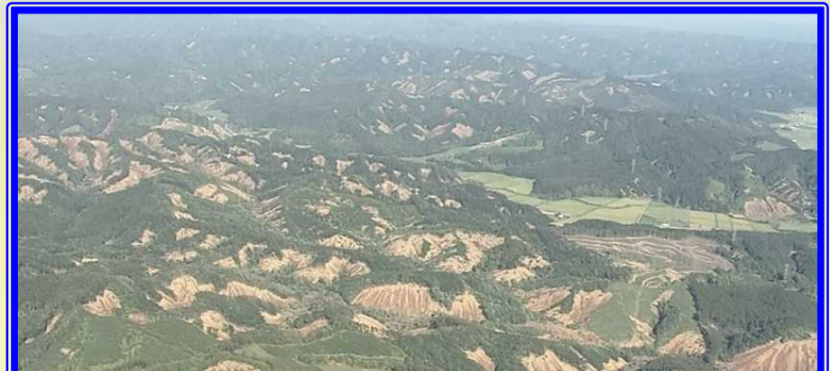
H30.9 胆振東部地震 被災状況調査(厚真町)