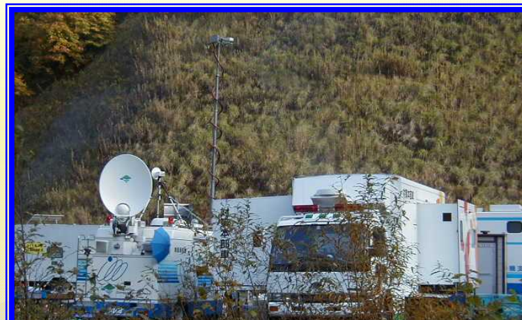
H13.10 一般国道333号 北見市北陽土砂崩落による出動(北見市)