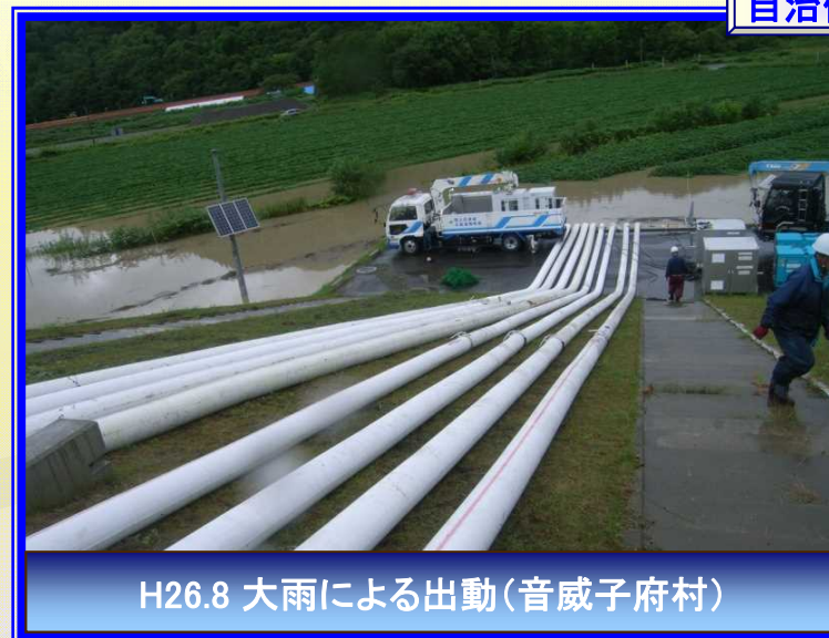
H26.8 大雨による出動(音威子府村)