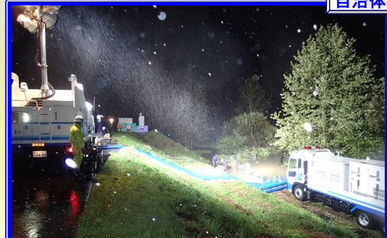
H28.8 十勝川水系途別川 大雨に伴う緊急排水作業による出動（幕別町）