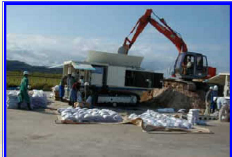
H13.9 台風15号による出動(女満別町)