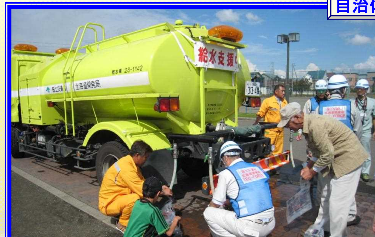
H26.9 江別市 市民への飲料水の給水（上江別小学校）