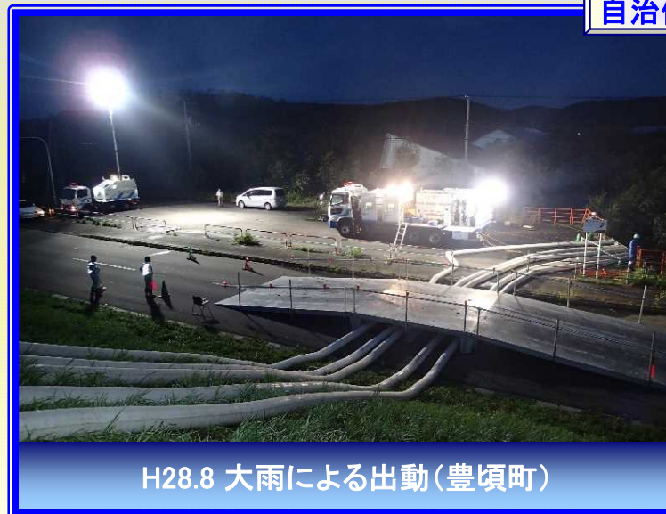
H28.8 大雨による出動(豊頃町)