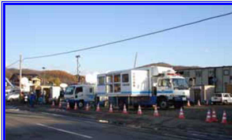
H18.11 突風災害による出動(佐呂間町)