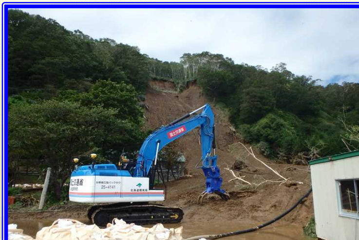
H28.8 遠隔操作による流木除去状況(羅臼町)