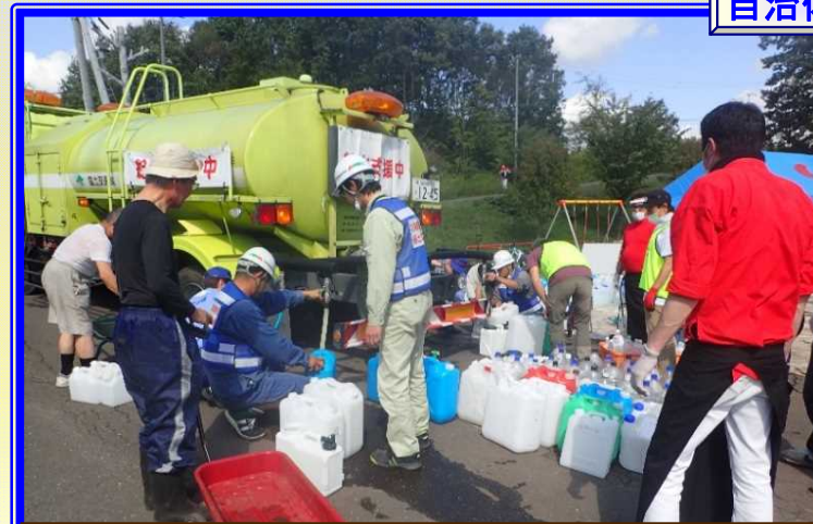
H30.9 胆振東部地震 安平町 市民への飲料水の給水