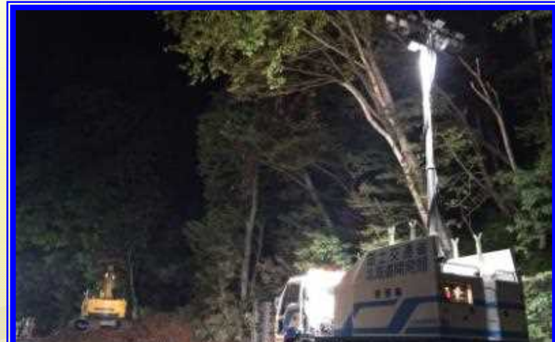
H26.9 一般国道453号 大雨に伴う土砂撤去作業による出動（千歳市）