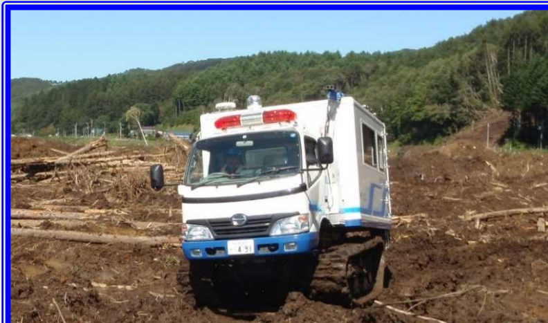
H30.9 胆振東部地震による出動（厚真町）