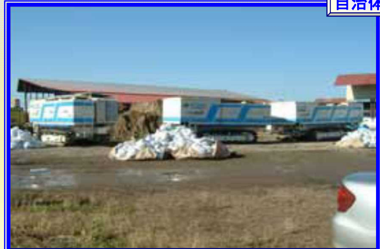
H18.10 低気圧による大雨による出動(美幌町)