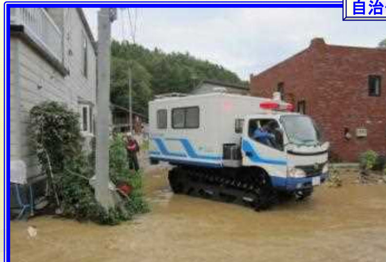
H26.9 大雨による出動（札幌市）