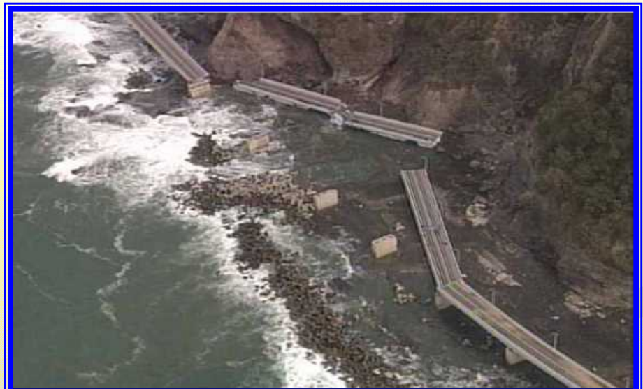
H16.9 R229大森大橋落橋の様子(神恵内村)