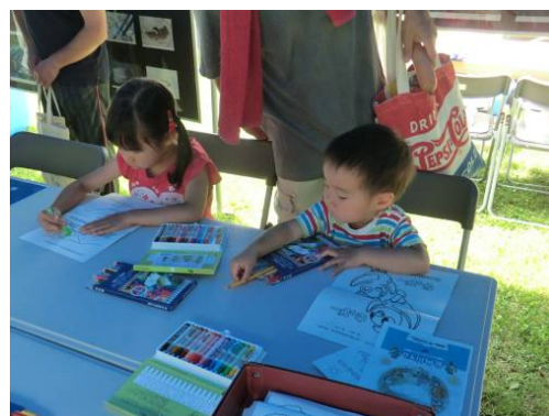
ぬり絵もおもしろかったよ！