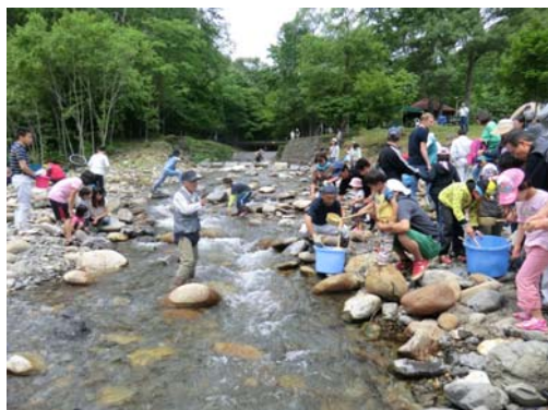
やまべの稚魚を放流してます