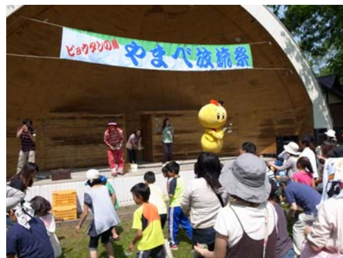
イベントも盛り上がってます