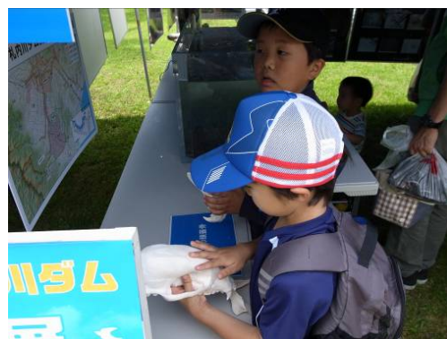
ヒグマの頭蓋骨、すごい！