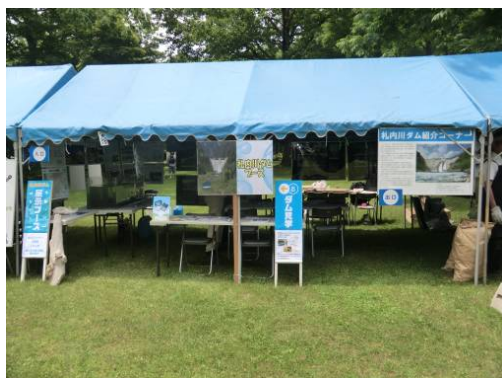
ダムの展示ブースはこちらです！