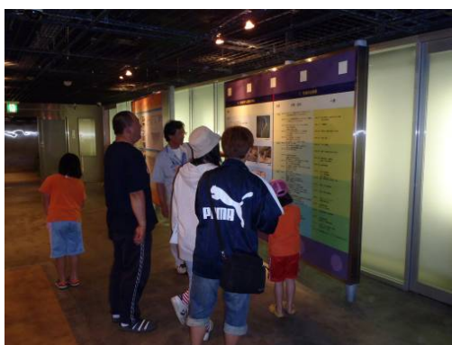
ダムのしくみがよくわかるね