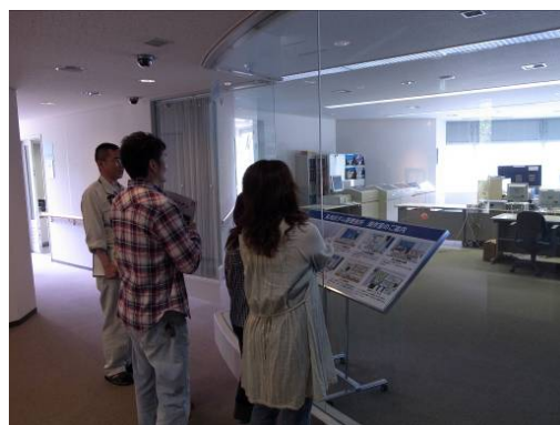
ここでダムを操作しているんだね