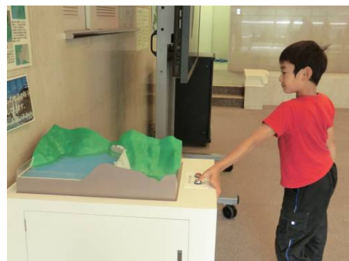
こうやって水が貯まるのか