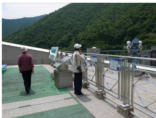
屋上展望室からの眺めは絶景！