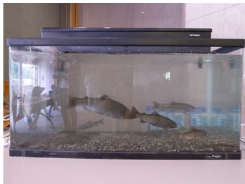
ダムでみられる魚のミニ水族館