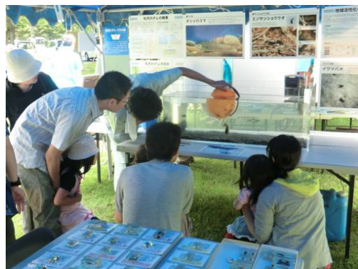
水槽の魚に餌をあげよう