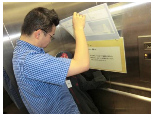
ダムクイズ、正解は？