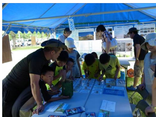
ダムにはこんなに昆虫がいるのか