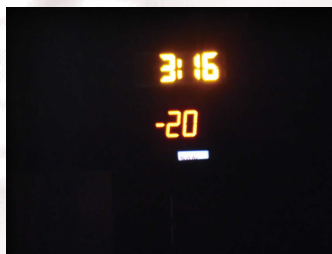
▲0時を過ぎてからが本番です。