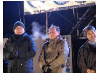
▲当部部長も参加。寒そう。

お笑いライブでは、テレビ等で人気の「マテンロウ」と「デニス」が登場し、爆笑の渦を巻き起こしました。