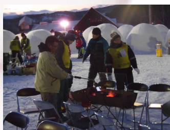
▲寒中BBQ。味がよく分かりません。