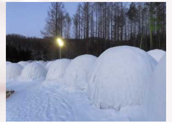
▲バルーンマンション。寒そう。