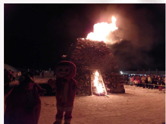
▲会場内には「命の火」が。