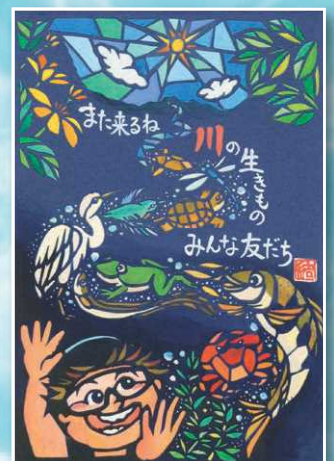
国土交通事務次官賞：古賀 結花さん (東京都)

"絵手紙"募集中!! 詳しくは https://www.mlit.go.jp/river/aigo/index.html