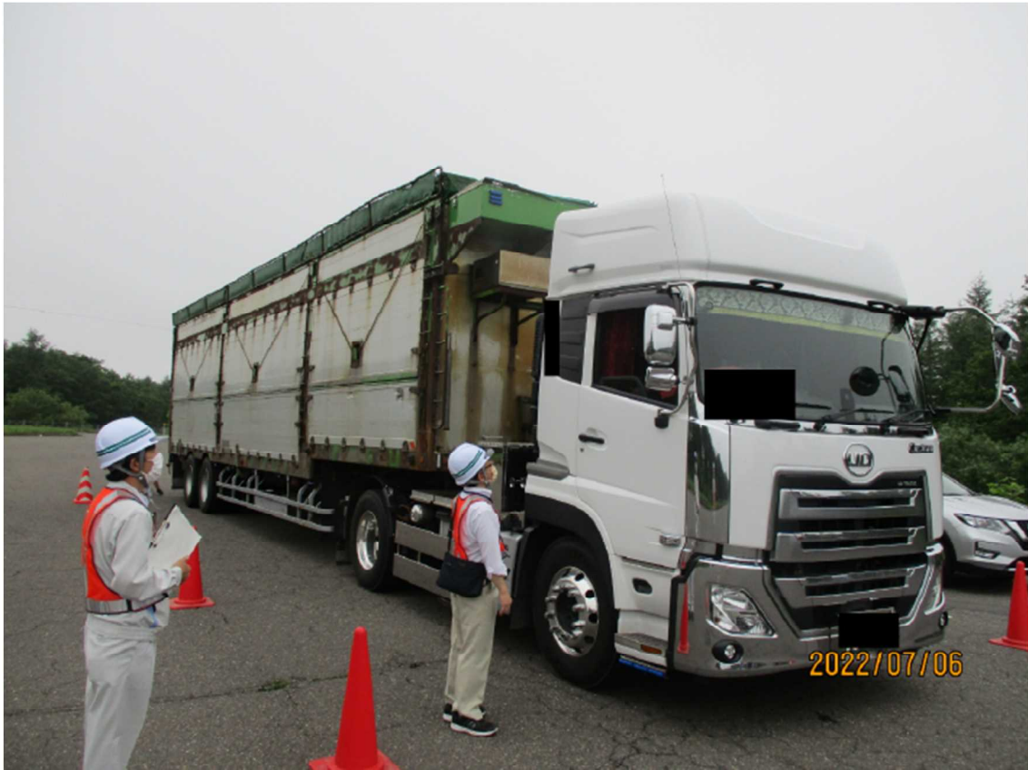
令和4年7月6日 清水 取締り状況写真