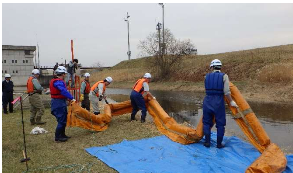
オイルフェンスの設置訓練