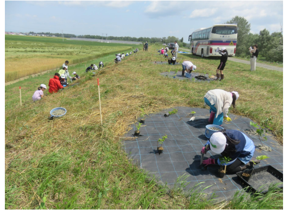
児童による植樹活動