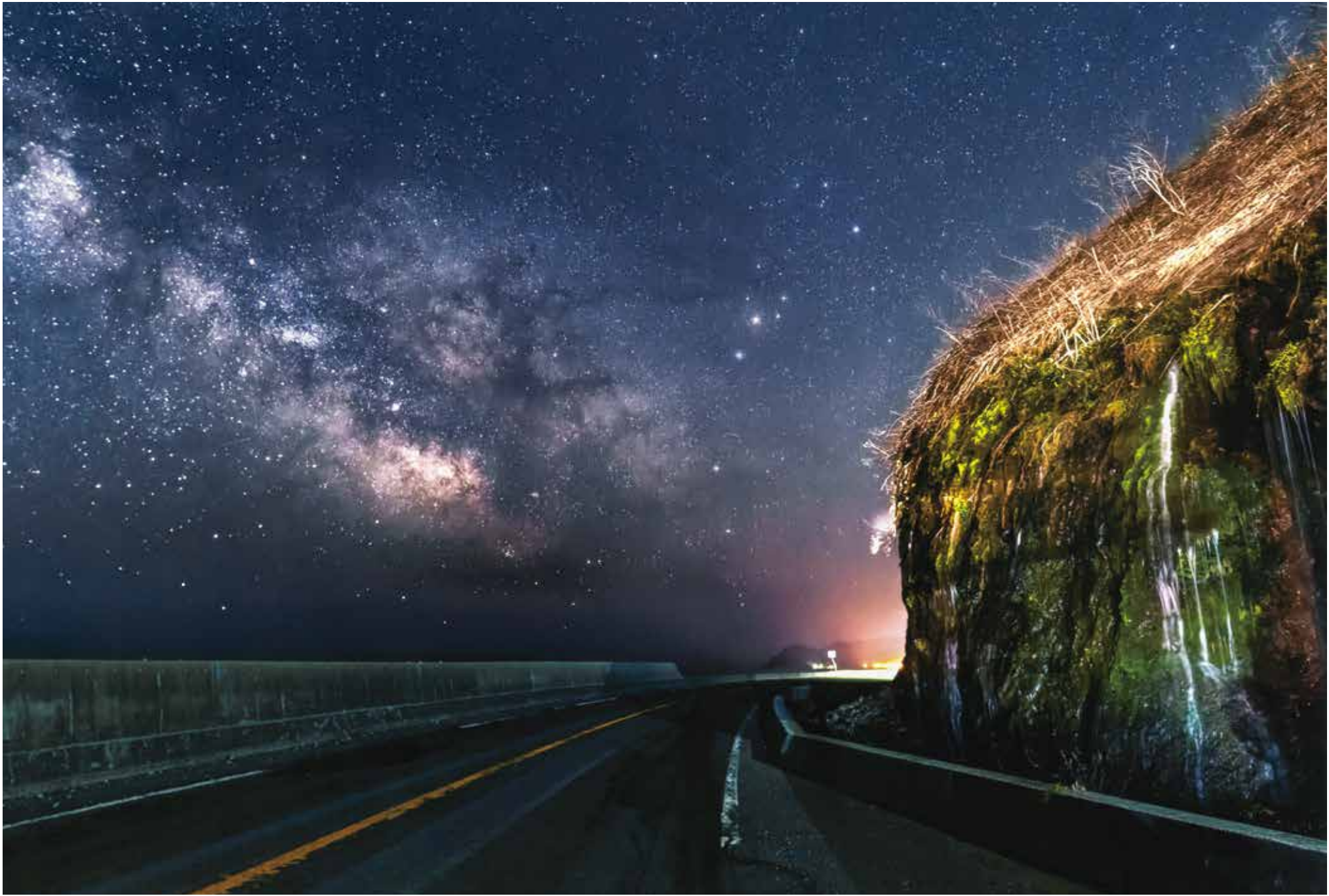
準グランプリ「フンベの滝の夜」神保 吉数 撮影地：広尾町