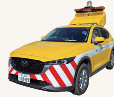
道路パトロールカー