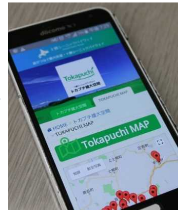
トカプチマップHPを表示