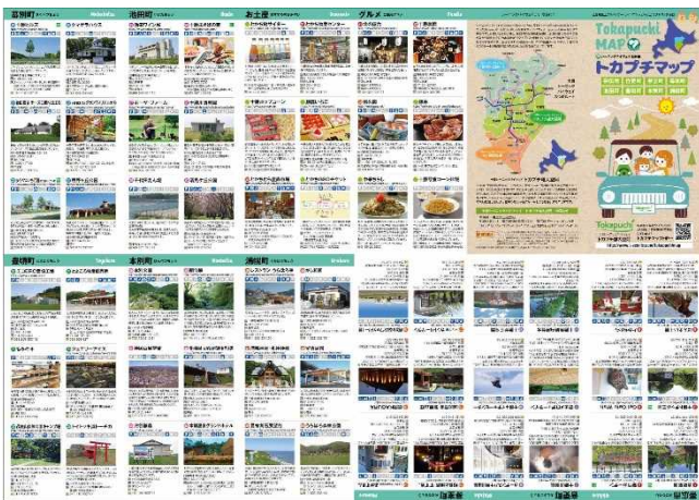
マップ中面：魅力的なイラストのマップに地元住民のロコミココメントを加えて掲載