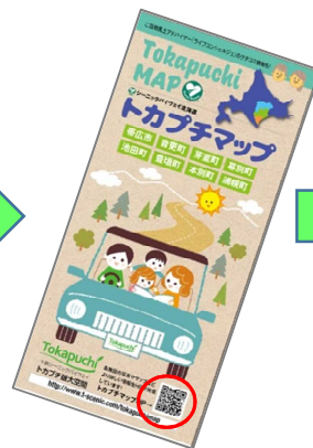
マップ表紙：QRコードを スマホで読込