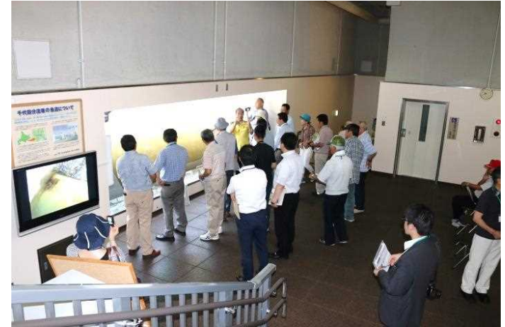
ご当地風土アドバイザー「ライフコンシェルジュ」との現地検証 場所：幕別町千代田新水路 魚道観察室（ととろーど）