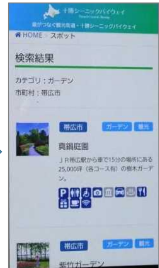
スポットの詳細情報を カンタン入手！