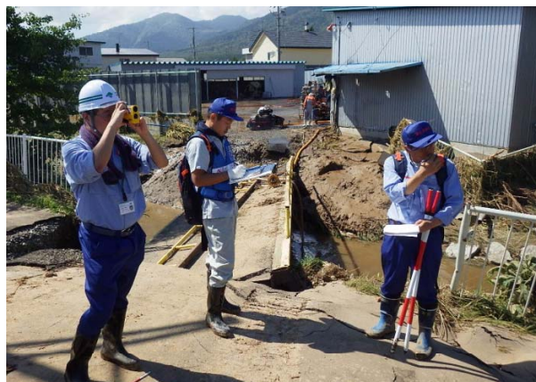
留萌開建河川班 被災箇所調査