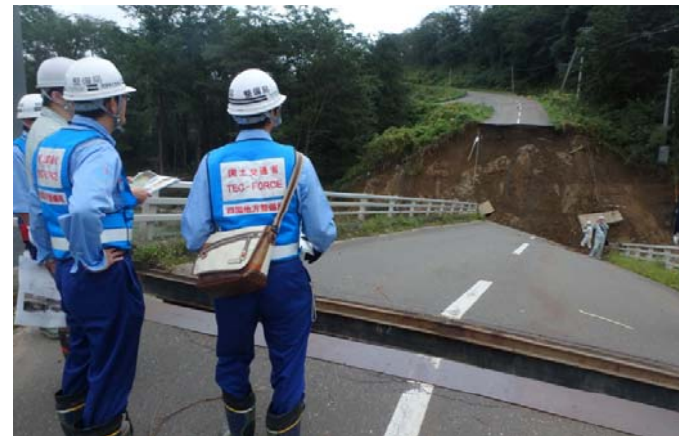
四国地整道路班 明星橋（岩内川）被災調査