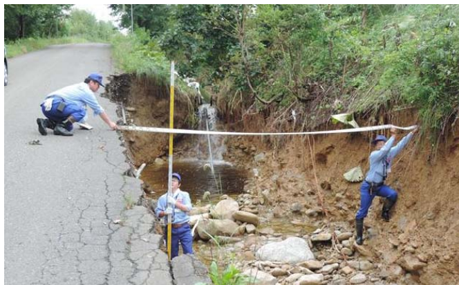
網走開建道路班 町道洗掘箇所調査