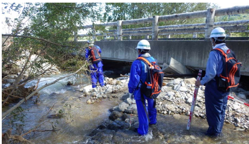
留萌河川班 造林川 丸山橋 被災状況調査