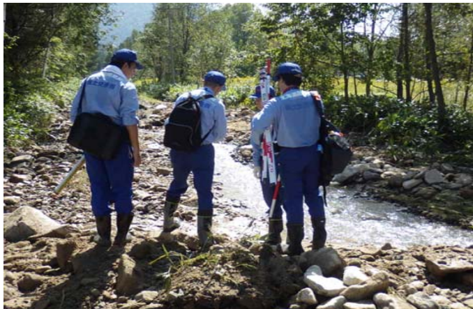
留萌開建道路班 被災箇所調査