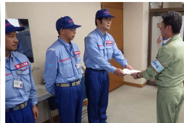
南富良野町長に調査結果を報告