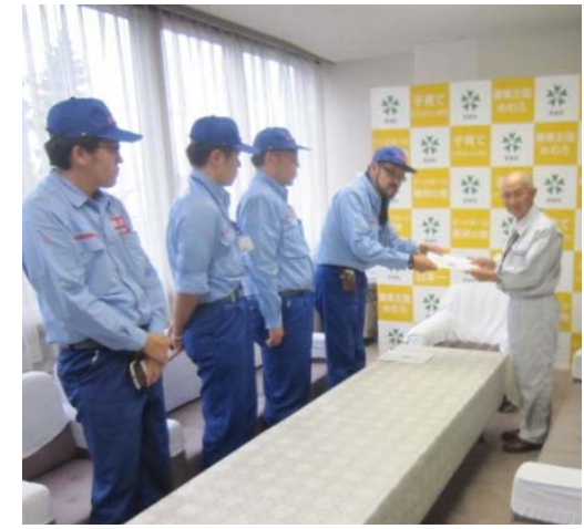
芽室町長に調査結果を報告