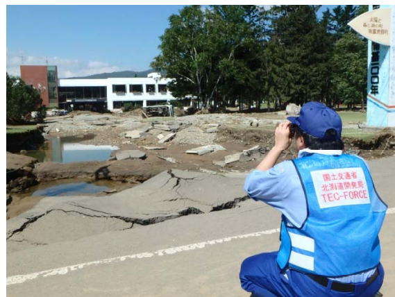
札幌開建道路班 幾寅地区 被災箇所調査