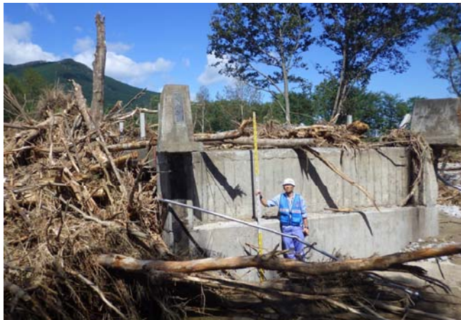
関東地整道路班 橋梁被災箇所の調査