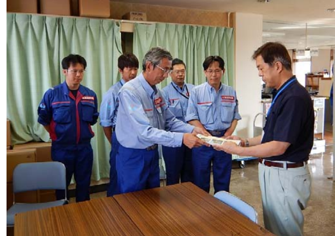
日高町建設課長に調査結果を報告