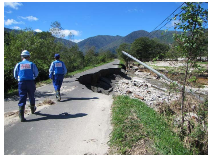
札幌道路班 羽帯17号道路 被災状況調査