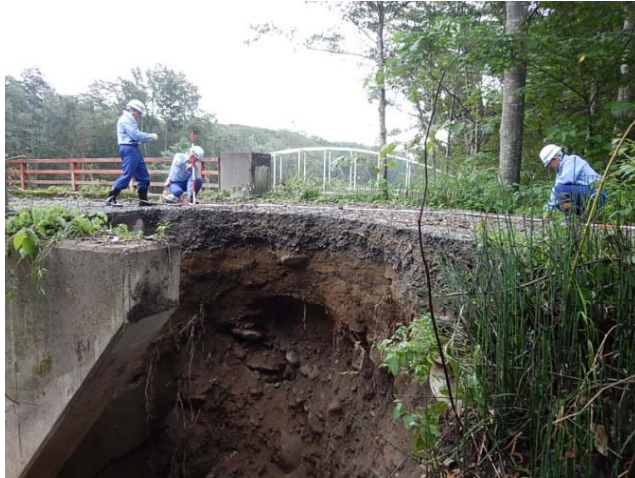
小樽開建道路班 西伏美橋被災調査