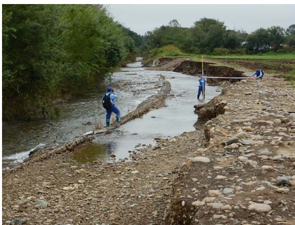
室蘭開建河川班 サラベツ川被災状況調査