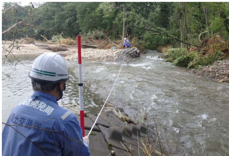
釧路開建河川班 久山川 河岸侵食、護岸崩落箇所調査