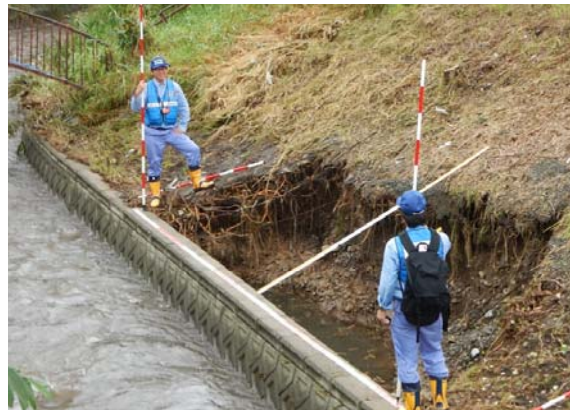
関東地整河川班 新得川 現地調査