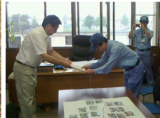
関東地整隊員から新得町長に調査結果を報告