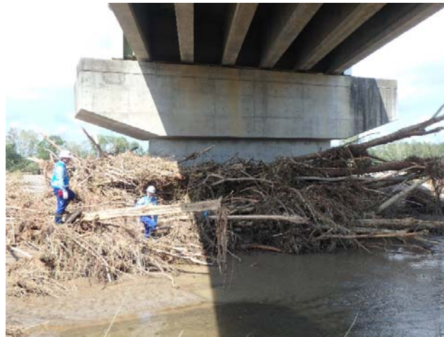
四国地整道路班 芽室大橋の現地調査