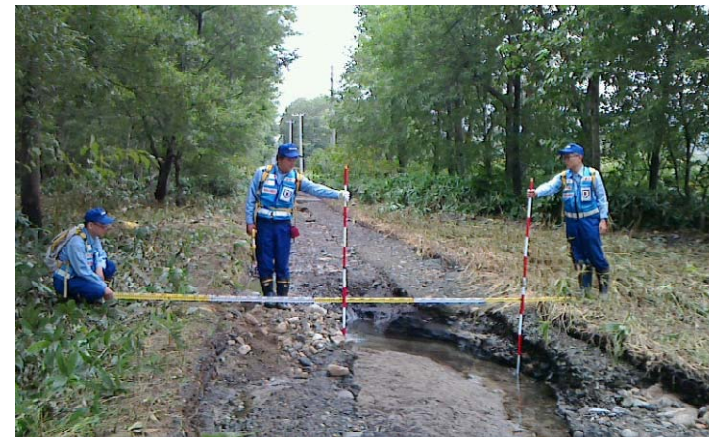
四国地整河川班 久山川沿い被災状況調査