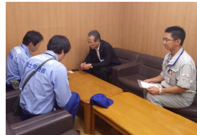
中札内村副村長に調査結果を報告