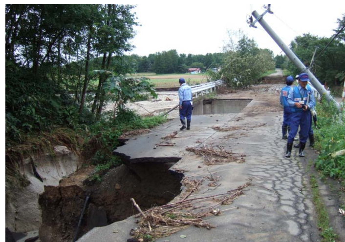
稚内開建道路班 旭山地区旭山橋 被災状況調査