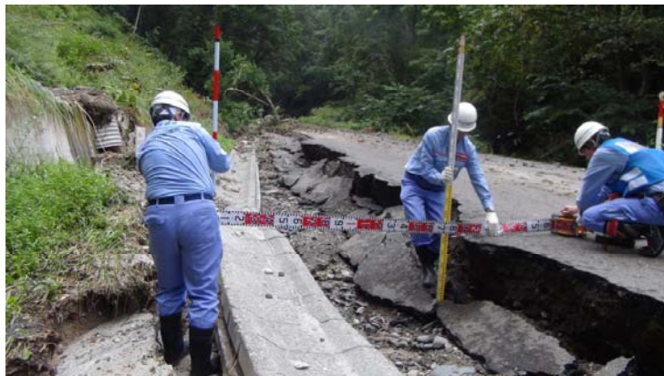
関東地整道路班 屈足地区現地調査