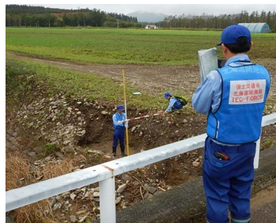
室蘭開建河川班 被災状況調査