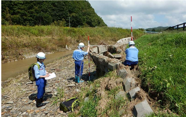
室蘭開建河川班 被災箇所調査