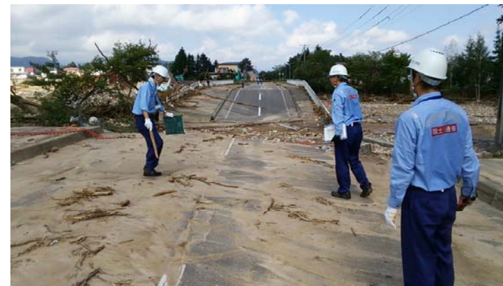
中国地整道路班 ベケレベツ川 橋梁調査